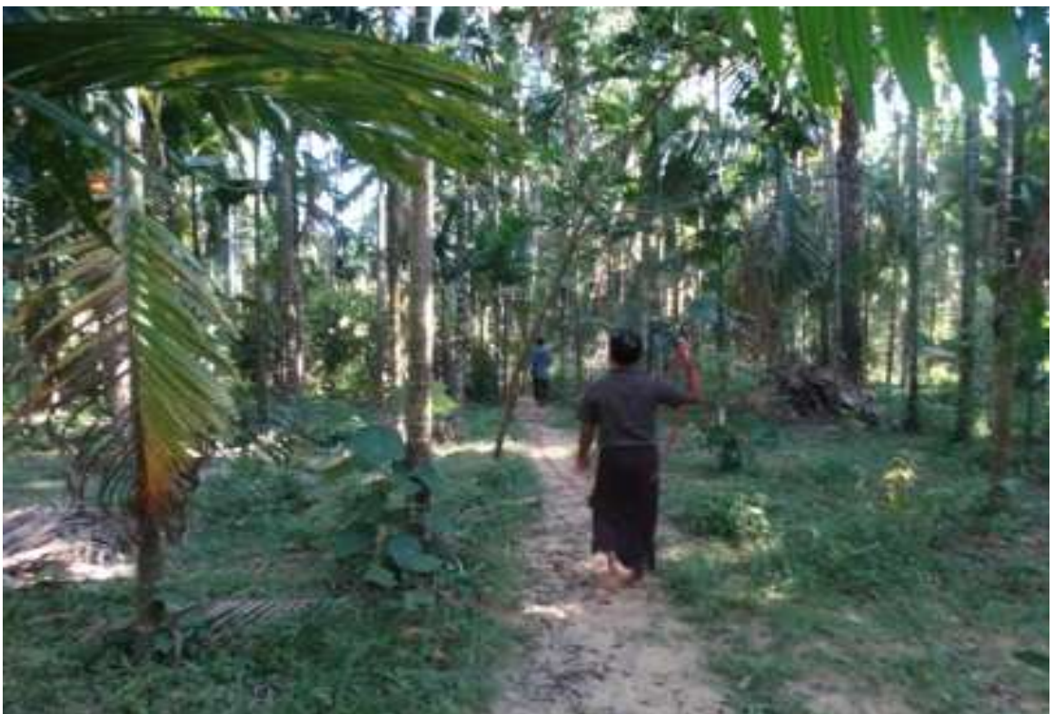
မြေသာလမ်းဖောက်လုပ်မည့် မြေနေရာအား တိုင်းတာခြင်း