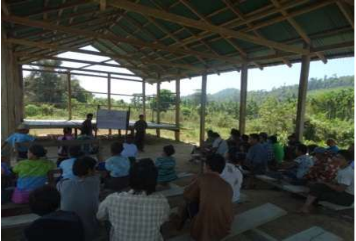
ပထမအကြိမ် ရွာလုံးကျွတ် အစည်းအဝေး