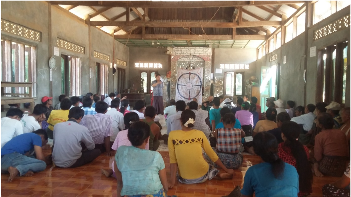
၂၀။ ကော်မတီဝင်များရွေးချယ်ခြင်းနှင့် ကျေးရွာဖွံ့ဖြိုးရေးအစီအစဉ်ဆောင်ရွက်မှုမှတ်တမ်းဓာတ်ပုံများ