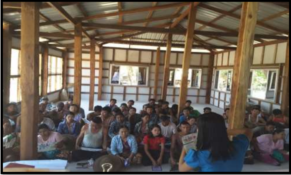
သာပေါင်းမြို့နယ်တွင် PRA Tools များ ပြုလုပ်ပုံ