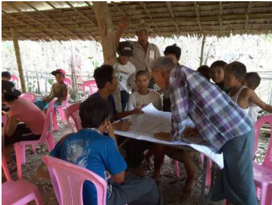
သာပေါင်းမြို့နယ်၊ ရှမ်းကွင်းအုပ်စု ။ညောင်ကုန်းကျေးရွာတွင် အစည်းအဝေးပြုလုပ်ပုံ