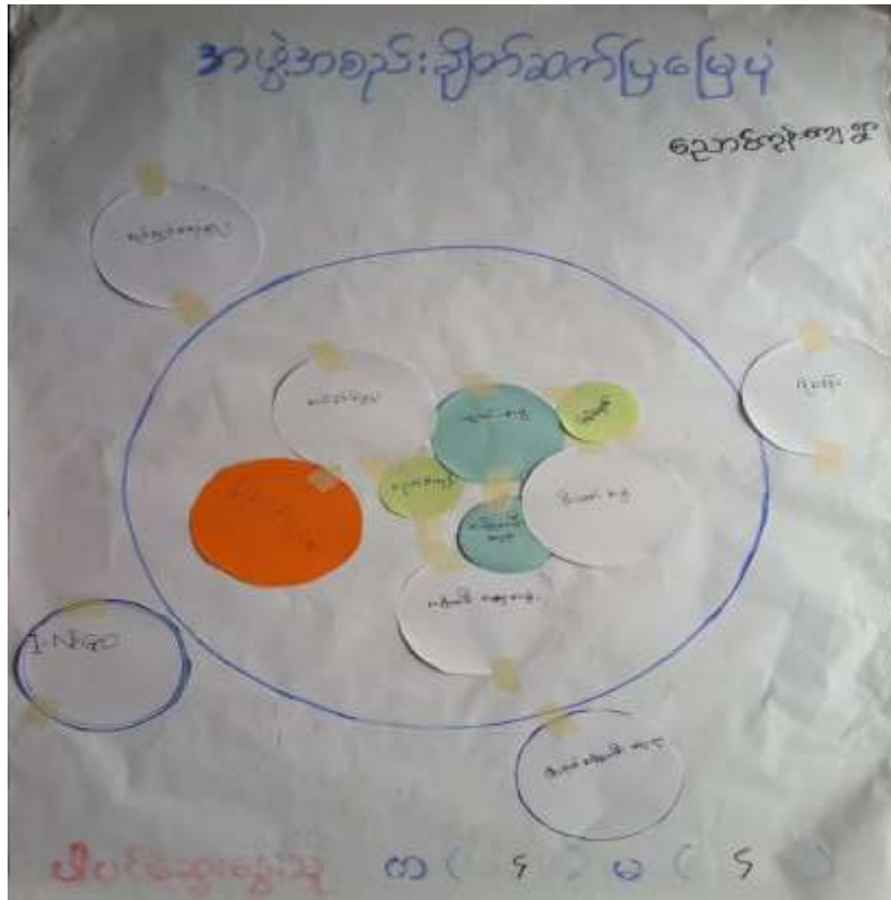
သုံးသပ်ချက်

အဖွဲ့အစည်းချိတ်ဆက်ပြဇယားကို သစ်ပုတ်ကုန်းကျေးရွာတွင်(၁၉.၁.၂၀၁၇)ရက်နေ့တွင် ရေးဆွဲဆွေးနွေးရာ ကျေးရွာအတွင်းအုပ်ချုပ်ရေးနှင့်ပတ်သက်၍ ရာအိမ်မှူး၊ ကျေးရွာအုပ်ချုပ်ရေးမှူးနှင့် မြို့နယ်အုပ်ချုပ်ရေးမှူး၊ မြို့နယ်ရဲစခန်းတို့နှင့် ချိတ်ဆက်ဆောင်ရွက်ပါသည်။