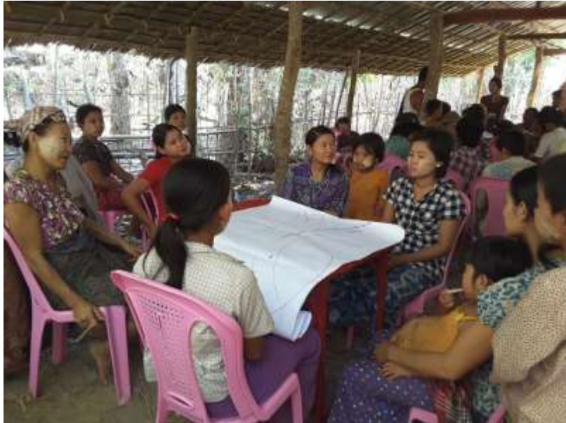
သာပေါင်းမြို့နယ်၊ ရှမ်းကွင်းအုပ်စု ။ညောင်ကုန်းကျေးရွာတွင် PRA Tools များ ပြုလုပ်ပုံ