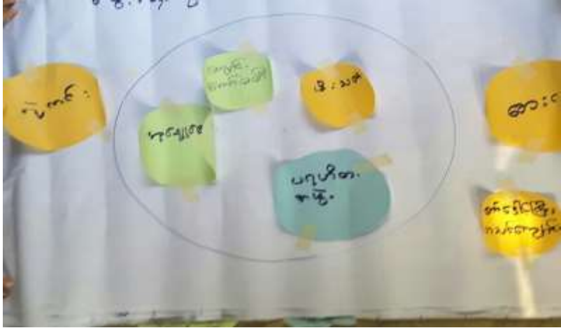
သုံးသပ်ချက်

အဖွဲ့အစည်းချိတ်ဆက်ပြဇယားကိုပေါက်ကုန်းကျေးရွာ၊ရပ်မိရပ်ဖအိမ်တွင်(၂၃.၂.၂၀၁၆)ရက်နေ့တွင် ရေးဆွဲဆွေးနွေးရာ ကျေးရွာအတွင်းအုပ်ချုပ်ရေးနှင့်ပတ်သက်၍ ရာအိမ်မှူး၊ ကျေးရွာအုပ်ချုပ်ရေးမှူးနှင့် မြို့နယ်အုပ်ချုပ်ရေးမှူး၊ မြို့နယ်ရဲစခန်းတို့နှင့် ချိတ်ဆက်ဆောင်ရွက်ပါသည်။