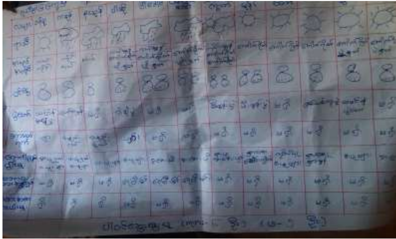
သုံးသပ်ချက်

ရွာသီခွင်ပြဇယားကို ပေါက်ကုန်းကျေးရွာ ရပ်မိရပ်ဖအိမ်တွင် (၂၃.၂.၂၀၁၇) ရက်နေ့တွင် ရေးဆွဲ ဆွေးနွေးရာ တန်ခူး၊ ကခုန်၊ တန်ဆောင်မုန်း၊ နတ်တော် ပြာသို၊ တပို့တွဲ၊ တပေါင်းလများ ခြောက်သွေ့ရာသီ ဖြစ်ပြီး နယုန်၊ ဝါဆို၊ ဝါခေါင်၊ တော်သလင်း၊ သီတင်းကျွတ်လများသည် မိုးရွာသွန်းသောလများ ဖြစ်ပါသည်။