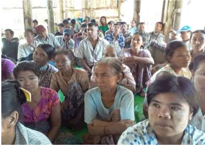
သာပေါင်းမြို့နယ်၊ ကမ္ဘွဲညောင်ကုန်းကျေးရွာအုပ်စု၊ စက်ဒေါင့်ကြီးကျေးရွာ PRA Tools များ ပြုလုပ်ပုံ