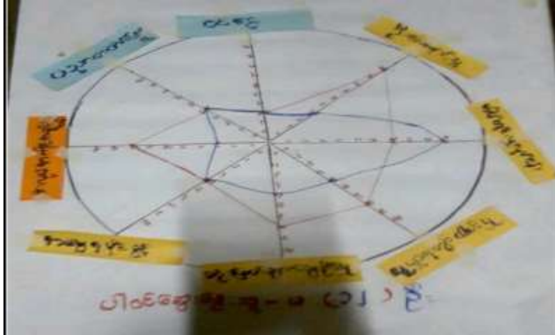
သုံးသပ်ချက်

ကျားမရေးရာကဏ္ဍကို ပင့်ကူအိမ်စနစ်ဖြင့်ပြသပုံကို စက်ဒေါင့်ကြီးကျေးရွာ၊ ဘုန်းကြီးကျောင်းတွင် (၂၃.၂.၂၀၁၇)ရက်နေ့တွင် ရေးဆွဲဆွေးနွေးရာ ဝင်ငွေ၊ လူမှုရေးလုပ်ငန်းတွင် ပါဝင်နိုင်မှု၊ ဆုံးဖြတ်ချက်ချနိုင်မှု၊ အလုပ်အကိုင်အခွင့်အလမ်းရရှိမှု၊ လုံခြုံမှု၊ ဦးဆောင်နိုင်မှု၊ ပညာရေးအခွင့်အလမ်း၊ အိမ်တွင်းမှုစသည့် အချက်များကို အခြေခံ၍ အမျိုးသားအုပ်စုနှင့် အမျိုးသမီးအုပ်စုခွဲပြီး သုံးသပ်ခဲ့ပါသည်။