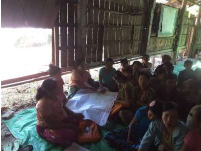
သာပေါင်းမြို့နယ်၊ ကမ္ဘွဲ၊ ညောင်ကုန်းကျေးရွာအုပ်စု ၊ ကမ္ဘွဲကျေးရွာ တွင် PRA Tools များ ပြုလုပ်ပုံ