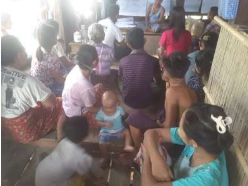
သာပေါင်းမြို့နယ်၊ ကမ္ဘွဲညောင်ကုန်းကျေးရွာအုပ်စု၊ ကမ္ဘွဲကျေးရွာ တွင် PRA Tools များ ပြုလုပ်ပုံ