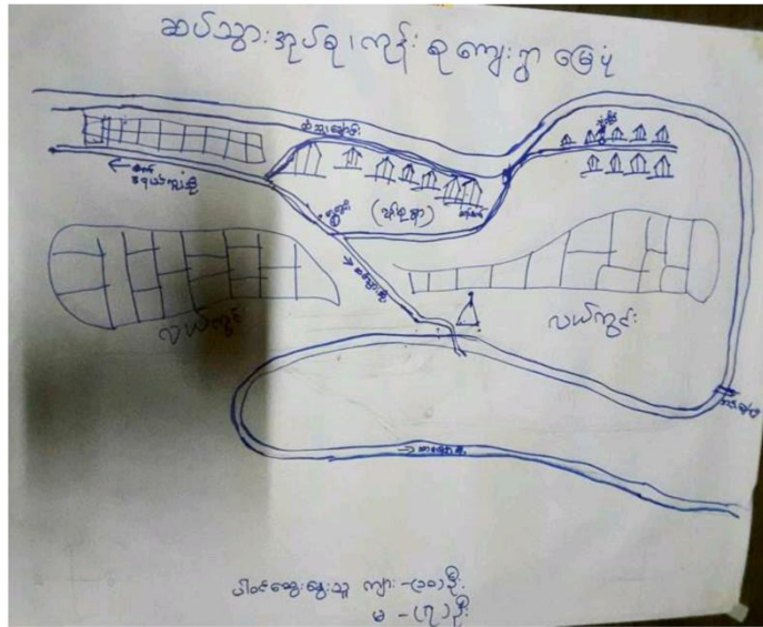
ကျေးရွာအသုံးသပ်ချက်