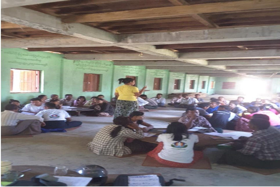
သာပေါင်းမြို့နယ်၊ ဆပ်သွားကျေးရွာအုပ်စု၊ ဆပ်သွားကျေးရွာတွင် PRA Tool လုပ်ပုံနေပုံများ