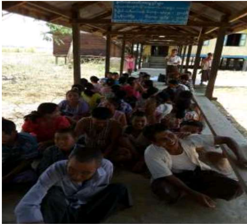
သာပေါင်းမြို့နယ်၊ သရက်တောကျေးရွာအုပ်စု၊ ပန်းပင်ဆိပ်ကျေးရွာ PRA Tool များပြုလုပ်နေပုံ