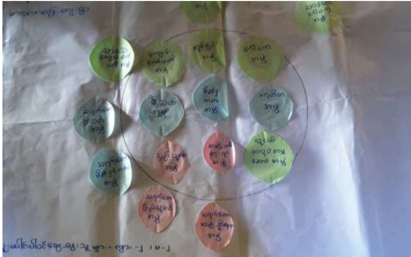
သုံးသပ်ချက်

ရွာထုတိုင်းဒေသကြီး၊ သာပေါင်းမြို့နယ်၊ သရက်တော ကျေးရွာအုပ်စု၊ မာလာကာကုန်းကျေးရွာ သာပေါင်းမြို့နယ်၊ သရက်တော ကျေးရွာအုပ်စု၊ မာလာကာကုန်း ကျေးရွာတွင် (၂၀၁၆.၁၀.၁၆) ရက်နေ့ သို့မဟုတ် တွင် ရေးဆွဲကြပါသည်။ အဖွဲ့အစည်းချိတ်ဆက်မှုပြုမြေပုံကို ရွာသူရွာသား များနှင့် ဆွေးနွေးရာတွင် အုပ်ချုပ်ရေးကဏ္ဍတွင် ကျေးရွာအုပ်ချုပ်ရေးများ မှ အထွေထွေ အုပ်ချုပ်ရေးဦးစီးဌာနနှင့် ချိတ်ဆက်ဆောင်ရွက်လျက်ရှိပါသည်။ ကျေးရွာအတွင်း လူမှုရေးနှင့် ကျန်းမာရေးအဖွဲ့အစည်းများ၊ အဖွဲ့အစည်းများ၊ အဖွဲ့အစည်းများ၊ အဖွဲ့များ ဖွဲ့စည်းထားရှိပါသည်။ မီးဘေးအန္တရာယ် ကာကွယ်ရေးအဖွဲ့အစည်း အဖွဲ့အစည်းများ ဖွဲ့စည်းထားရှိပါသည်။ ပညာရေးအဖွဲ့အစည်းများ၊ ကျန်းမာရေးအဖွဲ့အစည်းများ ဖွဲ့စည်းထားရှိပါသည်။ လုံခြုံရေးအဖွဲ့အစည်းများ၊ ကျေးရွာအုပ်စုအဖွဲ့အစည်းများ ဖွဲ့စည်းထားရှိပါသည်။ လူမှုရေးအဖွဲ့အစည်းများ၊ လူမှုရေးအဖွဲ့အစည်းများ ဖွဲ့စည်းထားရှိပါသည်။