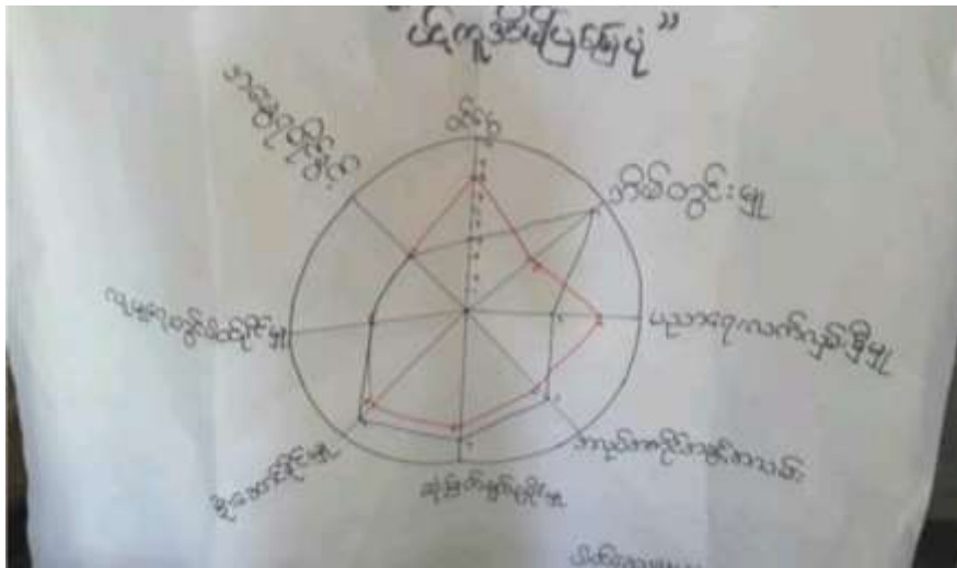
သုံးသပ်ချက်

ကျားမရေးရာကဏ္ဍကို ပင့်ကူအိမ်စနစ်ဖြင့် ပြသပုံ အိမ်စနစ်၊ ကျားမရေးရာ၊ ပညာရေး/လက်မှုပညာ၊ အသက်မွေးဝမ်းကျောင်း၊ အကျိုးစီးပွား ကျားမရေးရာကဏ္ဍကို ပင့်ကူအိမ်စနစ်ဖြင့် ပြသပုံကို ၁၅.၅.၂၀၁၆ ခုနှစ်မှစ၍ ပြုလုပ်ခဲ့ပါသည်။ ကျားမရေးရာကဏ္ဍကို ပင့်ကူအိမ်စနစ်ဖြင့် ပြသပုံကို ၁၅.၅.၂၀၁၆ ခုနှစ်မှစ၍ ပြုလုပ်ခဲ့ပါသည်။ ကျားမရေးရာကဏ္ဍကို ပင့်ကူအိမ်စနစ်ဖြင့် ပြသပုံကို ၁၅.၅.၂၀၁၆ ခုနှစ်မှစ၍ ပြုလုပ်ခဲ့ပါသည်။ ကျားမရေးရာကဏ္ဍကို ပင့်ကူအိမ်စနစ်ဖြင့် ပြသပုံကို ၁၅.၅.၂၀၁၆ ခုနှစ်မှစ၍ ပြုလုပ်ခဲ့ပါသည်။ ကျားမရေးရာကဏ္ဍကို ပင့်ကူအိမ်စနစ်ဖြင့် ပြသပုံကို ၁၅.၅.၂၀၁၆ ခုနှစ်မှစ၍ ပြုလုပ်ခဲ့ပါသည်။ ကျားမရေးရာကဏ္ဍကို ပင့်ကူအိမ်စနစ်ဖြင့် ပြသပုံကို ၁၅.၅.၂၀၁၆ ခုနှစ်မှစ၍ ပြုလုပ်ခဲ့ပါသည်။ ကျားမရေးရာကဏ္ဍကို ပင့်ကူအိမ်စနစ်ဖြင့် ပြသပုံကို ၁၅.၅.၂၀၁၆ ခုနှစ်မှစ၍ ပြုလုပ်ခဲ့ပါသည်။ ကျားမရေးရာကဏ္ဍကို ပင့်ကူအိမ်စနစ်ဖြင့် ပြသပုံကို ၁၅.၅.၂၀၁၆ ခုနှစ်မှစ၍ ပြုလုပ်ခဲ့ပါသည်။ ကျားမရေးရာကဏ္ဍကို ပင့်ကူအိမ်စနစ်ဖြင့် ပြသပုံကို ၁၅.၅.၂၀၁၆ ခုနှစ်မှစ၍ ပြုလုပ်ခဲ့ပါသည်။