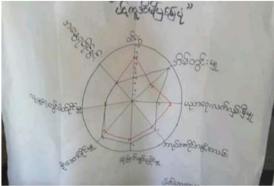
သုံးသပ်ချက်

ကျားမရေးရာကဏ္ဍကို ပင့်ကူအိမ်စနစ်ဖြင့် ပြသပုံ အိမ်တွင်းမျှ - မပညာရေးလက်ကိုင်ပစ္စည်းများ၊ အပူအအေးအညှိစနစ်၊ ဆွဲဆောင်မှု၊ လူမှုရေးဝတ္ထုများ၊ အိမ်ခြံမြေ ပညာရေးလက်ကိုင်ပစ္စည်းများ - မပညာရေးလက်ကိုင်ပစ္စည်းများ၊ အပူအအေးအညှိစနစ်၊ ဆွဲဆောင်မှု၊ လူမှုရေးဝတ္ထုများ၊ အိမ်ခြံမြေ အပူအအေးအညှိစနစ် - မပညာရေးလက်ကိုင်ပစ္စည်းများ၊ အပူအအေးအညှိစနစ်၊ ဆွဲဆောင်မှု၊ လူမှုရေးဝတ္ထုများ၊ အိမ်ခြံမြေ ဆွဲဆောင်မှု - မပညာရေးလက်ကိုင်ပစ္စည်းများ၊ အပူအအေးအညှိစနစ်၊ ဆွဲဆောင်မှု၊ လူမှုရေးဝတ္ထုများ၊ အိမ်ခြံမြေ လူမှုရေးဝတ္ထုများ - မပညာရေးလက်ကိုင်ပစ္စည်းများ၊ အပူအအေးအညှိစနစ်၊ ဆွဲဆောင်မှု၊ လူမှုရေးဝတ္ထုများ၊ အိမ်ခြံမြေ အိမ်ခြံမြေ - မပညာရေးလက်ကိုင်ပစ္စည်းများ၊ အပူအအေးအညှိစနစ်၊ ဆွဲဆောင်မှု၊ လူမှုရေးဝတ္ထုများ၊ အိမ်ခြံမြေ