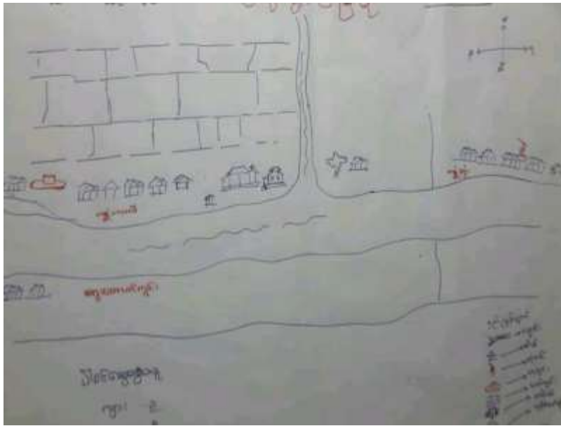
သုံးသပ်ချက်

ရေထက်တိုင်း၊ သာပေါင်း၊ ဖြူနယ်၊ သရက်တောကျေးရွာအုပ်စု ကျေးရွာအခြေပြမြေပုံ - ကျေးရွာအခြေပြမြေပုံ အပေါ် သုံးသပ်ချက် တည်နေရာ အမှ အစား ကျေးရွာအခြေပြမြေပုံ ကျေးရွာအခြေပြမြေပုံ ချိုးချောင်းပယ်တစ်ခု ဖြားလျက်တည်ရှိပြီး တစ်ခု ချောင်းတစ်ဖက်ကမ်းတွင် တည်ရှိပြီး ချောင်း၊ ရွှေတောင်တွင်း ကျေးရွာနှင့် အခြေပြမြေပုံ လျက် တည်ရှိပါသည်။ အရင်းအမြစ်များ အပေါ် အသုံးပြုမှု ကျေးရွာအခြေပြမြေပုံ ကျေးရွာအခြေပြမြေပုံတွင် အားလုံး ချိုးချောင်း ပါသည့် လယ်ယာ လုပ်ငန်းကို လုပ်ကိုင်ကြသည်။ အချို့ကောင်းသူများသည် ပဲဖျိုးစု ချိုက်ဖျိုးကြပြီး ဆီကြိတ်တက် လုပ်ငန်း လုပ်ကိုင်သူလည်း ရှိသည်။ လယ်ယာ မြေ ဝိုင် ဝိုင် ချိုး ချိုး သူများမှာ အငှားလုပ်သား အဖြစ်လည်းကောင်း၊ ရေလုပ်ငန်း လုပ်ကိုင်သူများလည်း ရှိသည်။ သောက်သုံးရေ ရရှိမှု ကျေးရွာအခြေပြမြေပုံ ကျေးရွာအခြေပြမြေပုံတွင် ရေတွင်း (၁) တွင်းနှင့် ရေတံကင် (၃) တွင်း ရှိပြီး သောက်သုံးရေ ရရှိမှု လုံလောက်မှု မရှိကြောင်း တွေ့ရသည်။ ရေတွင်း ရေကိုသာ အခြေပြမြေပုံ အဓိက အားထားသောက်သုံးနေရပါသည်။ ဘာသာရေး ကျေးရွာအခြေပြမြေပုံ ကျေးရွာအခြေပြမြေပုံတွင် ဘုန်းတော်ကြီးကျောင်း ၂ နေရာ၊ ဓမ္မာရုံ တို့ ရှိပြီး ရွာ၏ အနောက်ဘက် တစ်ဖက်တွင်လည်း သင်္ချိုင်း တစ်ခု ရှိပါသည်။ ကျေးရွာအခြေပြမြေပုံ ကျေးရွာအခြေပြမြေပုံတွင် ရေတွင်း ၃ နေရာ၊ သည် ဗုဒ္ဓဘာသာကို ကွယ်လွန်သူများ ဖြစ်ကြပါသည်။