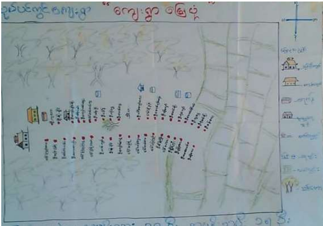
သုံးသပ်ချက်

ကျေးရွာ အခြေပြမြေပုံအပေါ် သုံးသပ်ချက် ၁- စာတင်ဆွဲရေးရရှိခဲ့ခြင်း စာတင်ဆွဲရေးရရှိခဲ့ခြင်းအတွက် စက်မှုတွင်းရေကန်ရှိပါသည်။ ဝါးဖြတ် လက်ထက်ပွင့်များလည်း ရှိပါသည်။ ရေအရင်းအမြစ်အောင်း၊ ဖိစည်း နေရာသို့ စားနပ်ရိက္ခာ တစ်ဖက်၊ တစ်ဖက်လည်း နားချိရအောင် များ ရေအရင်းအမြစ်ပါသည်။ များစွာဖြင့် စက်မှုတွင်းလို့သာ စာတင်ဆွဲရေးအတွက် အဆုံးပြုကြပါသည်။ ၂- လက်ပိုက်ဆက်ဆံပေးခြင်း စွဲတွင်းလမ်းများသည် စံနှုန်းမညီညွတ်ဘဲ ဖြစ်ပေါ်ခဲ့ပြီး မြို့နယ် ဗဟိုဌာနများမှ ဝန်ထမ်းများက အကူအညီပေးခဲ့ပြီး နားချိခြင်း၊ ဆက်လက်ပေး ဆွဲယူခြင်းဖြင့် စံနှုန်းမညီညွတ်ဘဲ ဖြစ်ပေါ်ခဲ့ပြီး မြို့နယ် တွင် လက်ပိုက်ဆက်ဆံပေးခြင်းအား အကူအညီပေးခြင်း ဖြစ်ပေါ်ခဲ့ပြီး ဖြစ်ပါသည်။ ၃- ပညာရေး ပညာရေး ဖွဲ့စည်းပေးခြင်းဖြင့် မူလတန်းတန်း ၅ နှင့် မူကြို ကျောင်း ဖွဲ့စည်းပေးခြင်း အားလက်ပိုက်ဆက်ဆံပေးခြင်းဖြင့် ဖွဲ့စည်း ထိုကဲ့သို့ ထိုကျောင်းများတွင် ပညာရေးဆိုင်ရာ အကူအညီပေးခြင်း လက် မကောင်းသည့်အခါတွင် ဖွဲ့စည်းပေးခြင်းဖြင့် ပညာရေးတွင် အကူအညီပေးခြင်း ဖြစ်ပါသည်။ ၄- ကျန်းမာရေး ကျန်းမာရေး ဖွဲ့စည်းပေးခြင်းဖြင့် မြို့နယ်အတွင်း အကူအညီပေးခြင်း အကူအညီပေးခြင်းအားလက်ပိုက်ဆက်ဆံပေးခြင်းဖြင့် ဖွဲ့စည်းပေးခြင်း ဖြစ်ပါသည်။ ၅- အခြေခံအဆောက်အအုံ လက်ပိုက်ဆက်ဆံပေးခြင်းဖြင့် အကူအညီပေးခြင်း ဖြစ်ပေါ်ခဲ့ပြီး အကူအညီပေးခြင်း အကူအညီပေးခြင်းဖြင့် အကူအညီပေးခြင်း ဖြစ်ပါသည်။ အကူအညီပေးခြင်း အကူအညီပေးခြင်းဖြင့် အကူအညီပေးခြင်း ဖြစ်ပါသည်။ အကူအညီပေးခြင်း အကူအညီပေးခြင်းဖြင့် အကူအညီပေးခြင်း ဖြစ်ပါသည်။ အကူအညီပေးခြင်း အကူအညီပေးခြင်းဖြင့် အကူအညီပေးခြင်း ဖြစ်ပါသည်။