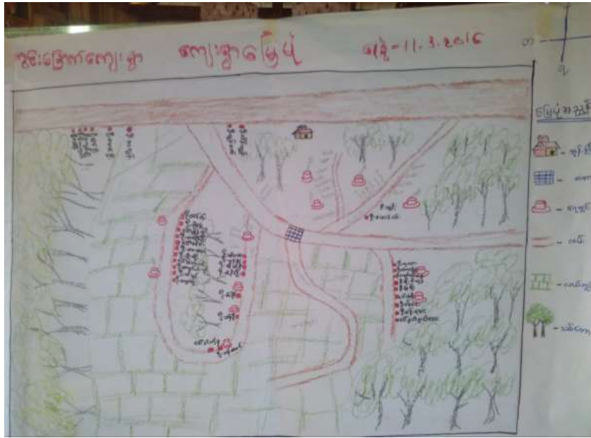
သုံးသပ်ချက်

၁။ စာတင်သုံးရွာရရှိချိန် စာတင်သုံးရွာ ရရှိချိန်အနေဖြင့် လက်ထက်တွင်းများသာ ရှိပါသည်။ ဇေယျာဝတီအဖြစ်ကောင်းပါသည်။ သို့သော် ရွာရပ်ထဲ တစ်ဝိုက်တွင် နေရာများ ရေခဲအောက်ပါသည်။ မိုးရာသီ တွင် စောင်းလျှော့ခြင်းကြောင့် ရေတွင်းများ စုန်ဖျက်ခြင်းများ ရှိပါ သည်။ ထို့ကြောင့် စာတင်သုံးရွာအစစ်အစင် ရှိပါသည်။ ၂။ လမ်းပန်းဆက်သွယ်ရေး ရွာတွင်းလမ်းသည် မြေသာလမ်းဖြစ်၍ မိုးရာသီတွင် ဗဟိုကင်း၊ နှစ်စတင်နေရာတွင် ရေဝင်ခြင်းများ ရှိပါသည်။ ရွာတွင်းဆက် လမ်းများသည် မြေသာလမ်းများဖြစ်ကာကြောင့် ရွာရပ်ထဲတွင် ထမ်းမလောင်း၍ မိုးရာသီတွင် ဗဟိုကင်း၊ နှစ်စတင်နေရာများတွင် ရေဝင်ခြင်း၊ လျှပ်များအားလုံးအဖြစ် မိုးကုတ်တွင် လမ်းများပျက်စီး ခြင်းများ ရှိပါသည်။ ထို့ကြောင့် လမ်းပန်းဆက်သွယ်ရေး အခက်အခဲ ရှိပါသည်။ ၃။ ယဉ်ကျေးရေး ယဉ်ကျေးရေးနှင့်ပတ်သက်၍ လူငယ်များလျောင်း ဖွံ့ဖြိုးရေး တွင် မရှိပါ။ ၄၅ မိနစ်မျှစားတာ အခြားကျေးရွာသို့ အားရစွာ ထက်ဝင်ရပါသည်။ မိုးရာသီတွင် ကစားများ ကျောင်းသွားရန် အခက် အခဲရှိပါသည်။ ထို့ကြောင့် ယဉ်ကျေးရေးနှင့် ပတ်သက်၍ ရေပျော်အား နည်းနေပါသည်။ ၄။ ကျန်းမာရေး ကျန်းမာရေးနှင့်ပတ်သက်၍လည်း မရှိပါ။ မြို့နယ် အစုအဝေးသို့သာ အားရစွာလာရပါသည်။ ကျန်းမာရေးစီမံချက်များ မရှိသောကြောင့် ကျန်းမာရေးဝန်ထမ်းများ လာရောက်ပါသည်။