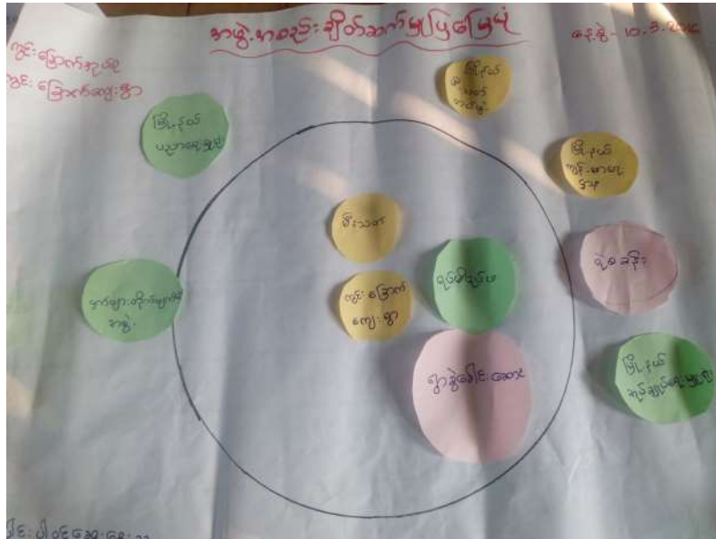
သုံးသပ်ချက်

ဘာပေါင်းမြို့နယ် ကွင်းခြောက်ကျေးရွာအုပ်စု ကွင်းခြောက်ကျေးရွာ တွင် 10.3.2016 ရက်စွဲရှိ ကွင်းခြောက်ကျေးရွာ ဝေဖန်တန်း ရေးဆွဲခဲ့ပါသည်။ အဖွဲ့အစည်းချိတ်ဆက်ပြဇယားကို ဝေဖန်ဆောင်ရွက် နိုင် စေရေးအတွက် ကွင်းခြောက်ကျေးရွာအတွင်း ကျွန်ုပ်တို့၏ ဝေဖန်တန်း ဝေဖန်ဆောင်ရွက်ရန် ကျွန်ုပ်တို့၏ ဝေဖန်တန်းအတွက် အထောက်အကူပြုရန် ချိတ်ဆက် ဆောင်ရွက်ပေးရန်ပါရှိပါသည်။ ထို့ပြင် ဝေဖန်တန်းအဖွဲ့များ ရှိပါသည်။ ကျန်းမာရေးအဖွဲ့အစည်း ဝေဖန်တန်းအဖွဲ့အစည်း ဝေဖန်တန်းအဖွဲ့အစည်း ဝေဖန်တန်းအဖွဲ့အစည်း ဝေဖန်တန်းအဖွဲ့အစည်း ဝေဖန်တန်းအဖွဲ့အစည်း ဝေဖန်တန်းအဖွဲ့အစည်း ဆောင်ရွက်ပေးရန်ပါရှိပါသည်။ ထို့ပြင် ဝေဖန်တန်းအဖွဲ့အစည်း ဝေဖန်တန်းအဖွဲ့အစည်း ဖွဲ့စည်းပေးရန်ပါရှိပါသည်။