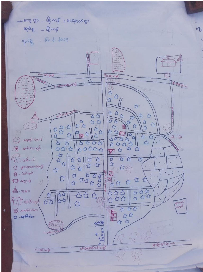
တည်နေရာ မြောက်လတ္တီကျု : ၂၁.၄၃ နှင့် အရှေ့လောင်ဂျီကျု : ၉၅.၆၂