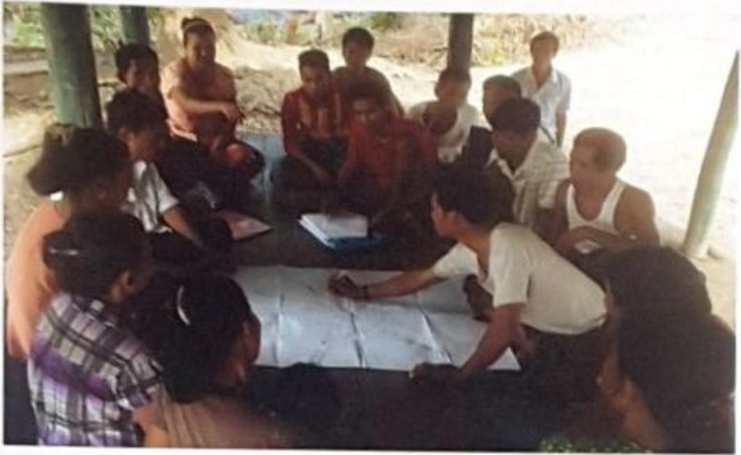
အန်ပီဝကျေးရွာ၊ တမန်းသားကျေးရွာအုပ်စု လူထုအစည်းအဝေးမှတ်တမ်းဓာတ်ပုံ