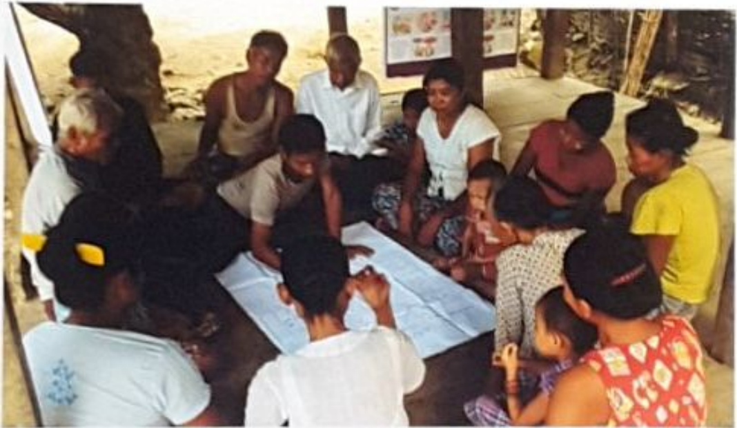
အန်ပီဝကျေးရွာ၊ တမန်းသားကျေးရွာအုပ်စု ကျေးရွာလူထုအစည်းအဝေးမှတ်တမ်းဓာတ်ပုံ