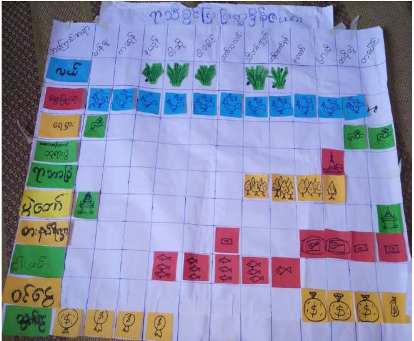
ဆိတ်ကြီးကျေးရွာဒေသကင်းကျေးရွာအုပ်စု