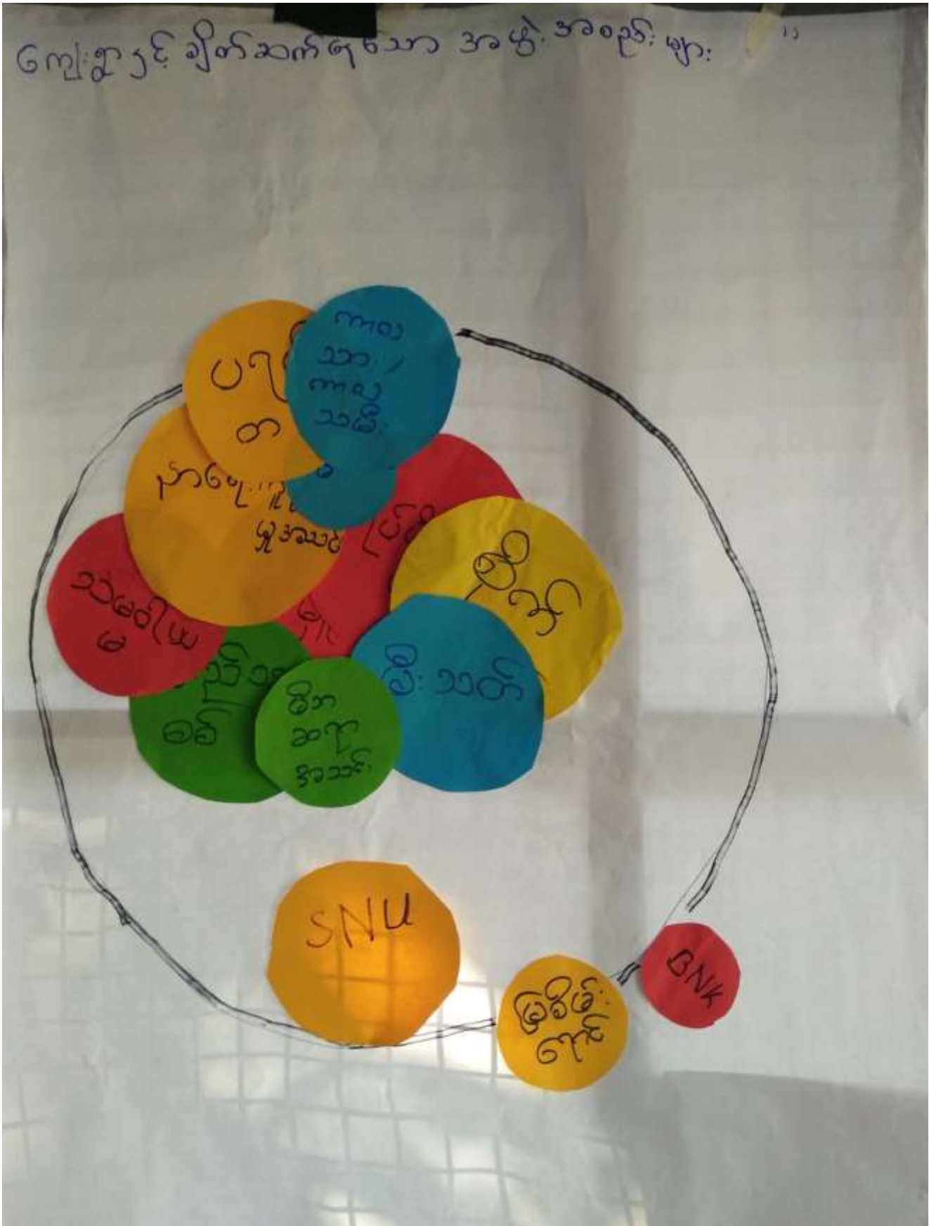
ဆိတ်ကြီးကျေးရွာဒေးကင်းကျေးရွာအုပ်စု

ကျေးဇူးပြင် ချိတ်ဆက်ရသော အဖွဲ့ အစည်း များ