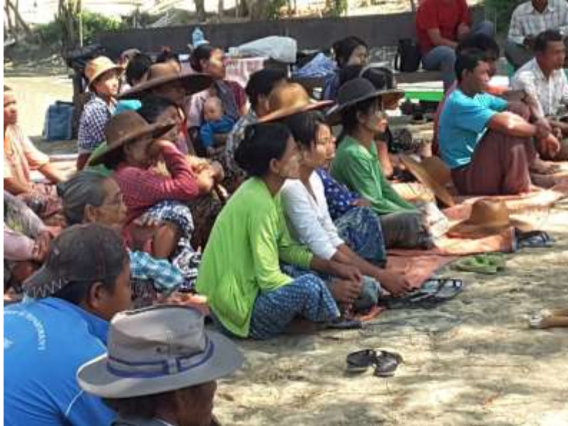
ဧရာဝတီတိုင်းဒေသကြီး၊ သာပေါင်းမြို့နယ် တလုပ်ကုန်းကျေးရွာအုပ်စု ဦးတို့ရွာ PRA Tools များ ပြုလုပ်ပုံ