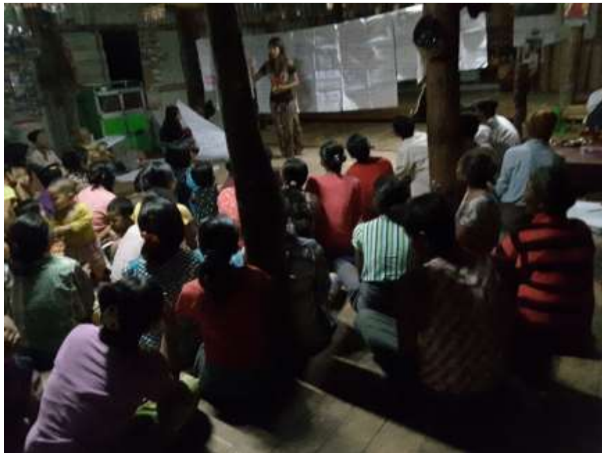
သာပေါင်းမြို့နယ်၊ ငဝန်ကြို့ကုန်းကျေးရွာအုပ်စု၊ ငဝန်ကြို့ကုန်းကျေးရွာတွင်