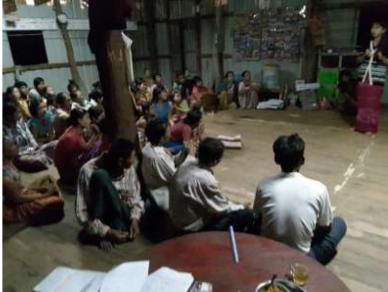
သာပေါင်းမြို့နယ်၊ ငဝန်ကြို့ကုန်းကျေးရွာအုပ်စု၊ ငဝန်ကြို့ကုန်းကျေးရွာ ကျေးရွာအစည်းအဝေးပွဲများ၏ မှတ်တမ်းဓာတ်ပုံများ