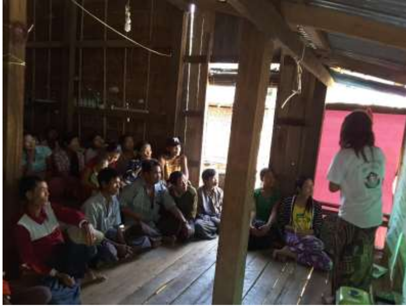
ဧရာဝတီတိုင်းဒေသကြီး၊ သာပေါင်းမြို့နယ် တလုပ်ကုန်းကျေးရွာအုပ်စု ဒိုက်ကြီးကွင်းရွာ ကျေးရွာအစည်းအဝေးပွဲများ၏ မှတ်တမ်းဓာတ်ပုံများ