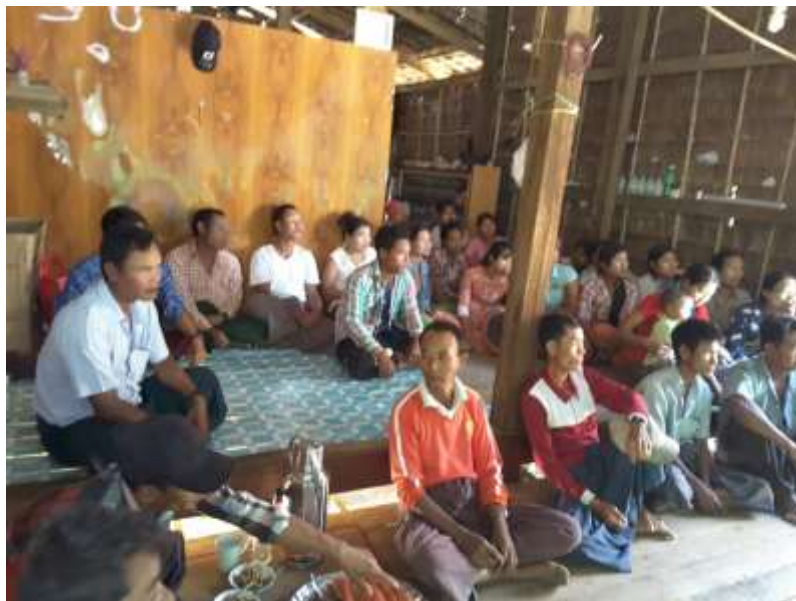
ဧရာဝတီတိုင်းဒေသကြီး၊ သာပေါင်းမြို့နယ် တလုပ်ကုန်းကျေးရွာအုပ်စု ဒိုက်ကြီးကွင်းရွာ