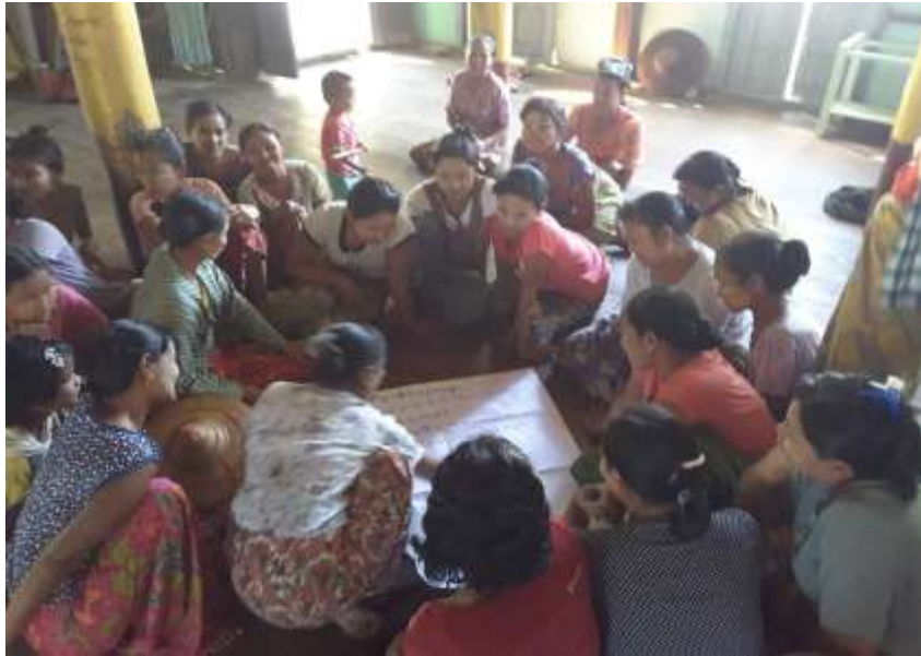
ဧရာဝတီတိုင်းဒေသကြီး၊ သာပေါင်းမြို့နယ် တာလုပ်ကုန်းကျေးရွာအုပ်စု ခိုက်ကြီးကွင်းရွာ PRA Tools များ ပြုလုပ်ပုံ