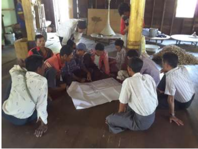
သာပေါင်းမြို့နယ် ၊ တလုပ်ကုန်းကျေးရွာအုပ်စု ၊ အငူကြီးကျေးရွာတွင် PRA Tools များ ပြုလုပ်ပုံ