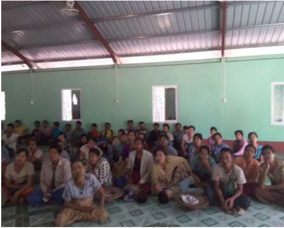
သာပေါင်းမြို့နယ်၊ ဆီဆုံကျေးရွာအုပ်စု၊ သရက်အုပ်ကျေးရွာ PRA Tools များ ပြုလုပ်ပုံ