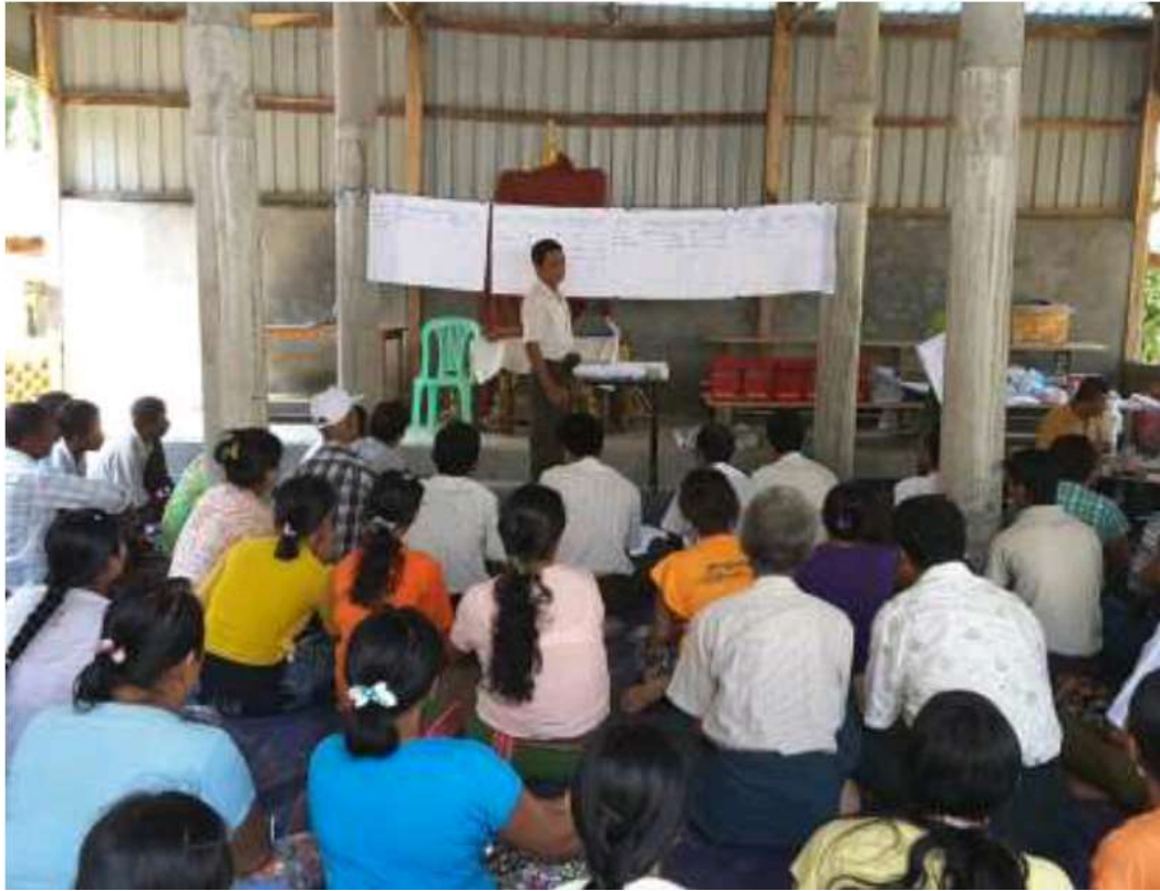
သာပေါင်းမြို့နယ်၊ ဆီဆုံကျေးရွာအုပ်စု၊ သရက်အုပ်ကျေးရွာ တွင် PRA Tools များ ပြုလုပ်ပုံ