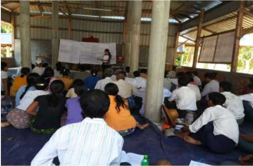
သာပေါင်းမြို့နယ်၊ ဆီဆုံကျေးရွာအုပ်စု၊ သဘော့ချောင်းကျေးရွာ ကျေးရွာအစည်းအဝေးပွဲများ၏ မှတ်တမ်းဓာတ်ပုံများ