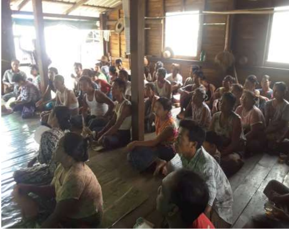
သာပေါင်းမြို့နယ်၊ ဆီဆုံကျေးရွာအုပ်စု၊ ပိန္နဲကုန်းကျေးရွာ PRA Tools များ ပြုလုပ်ပုံ