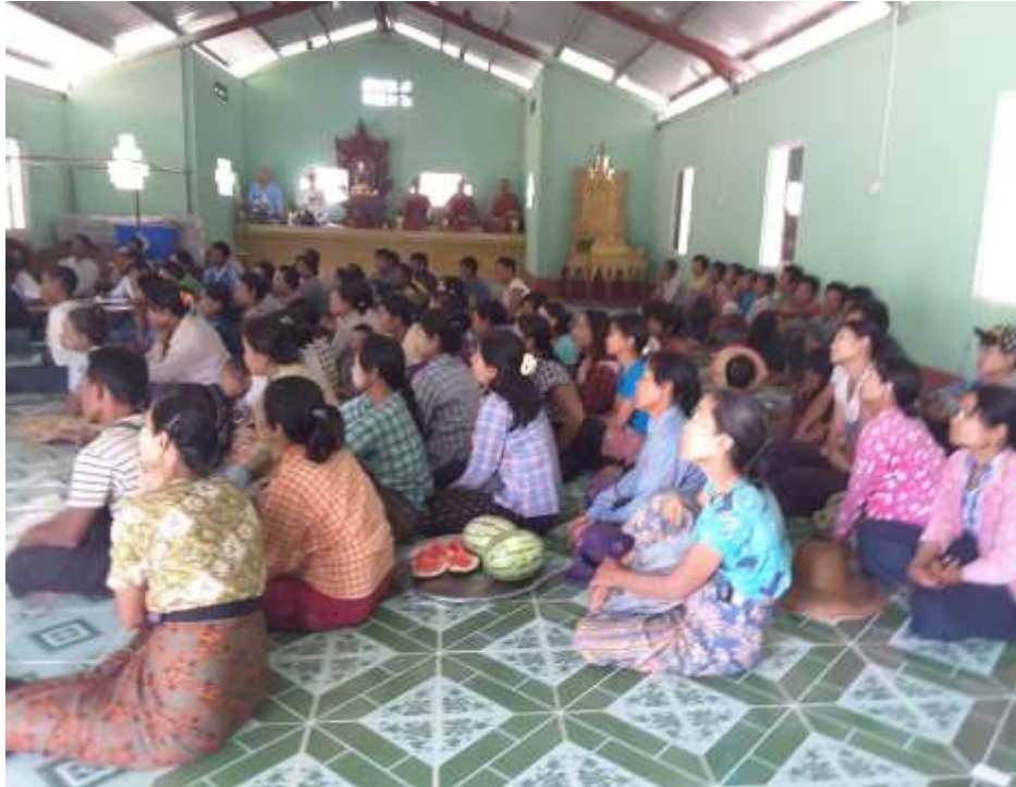
သာပေါင်းမြို့နယ်၊ ဆီဆုံကျေးရွာအုပ်၊ ဆီဆုံကျေးရွာ PRA Tools များ ပြုလုပ်ပုံ