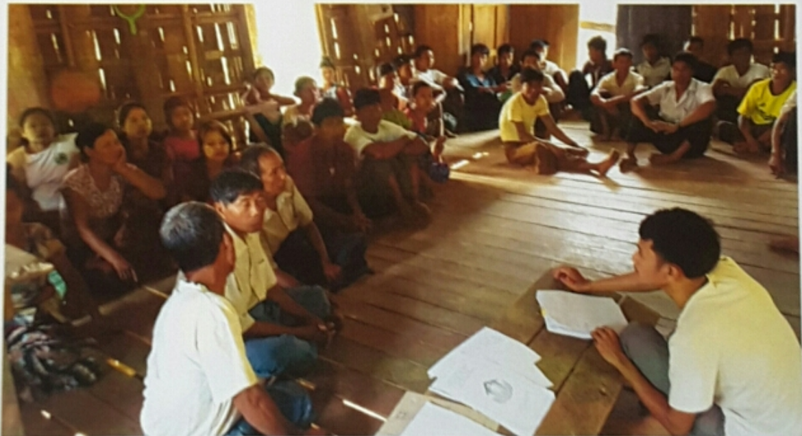
ဘီလောင်းဝကျေးရွာ၊ ဆင်အိုးဝ (၂) ကျေးရွာအုပ်စု ကျေးရွာလူထုအစည်းအဝေးမှတ်တမ်းဓာတ်ပုံ