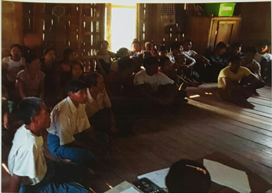
ဘီလောင်းဝကျေးရွာ၊ ဆင်အိုးဝ (၂) ကျေးရွာအုပ်စု ကျေးရွာလူထုအစည်းအဝေးမှတ်တမ်းဓာတ်ပုံ