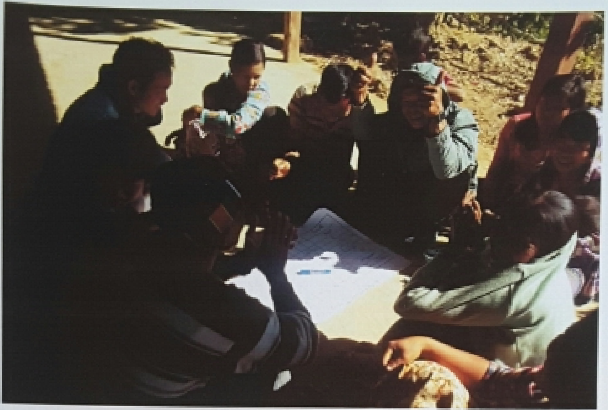
အောက်ရှင်းလက်ဝကျေးရွာ၊ ရှင်းလက်ဝကျေးရွာအုပ်စု ကျေးရွာလူထုအစည်းအဝေးမှတ်တမ်းတင်ပုံ