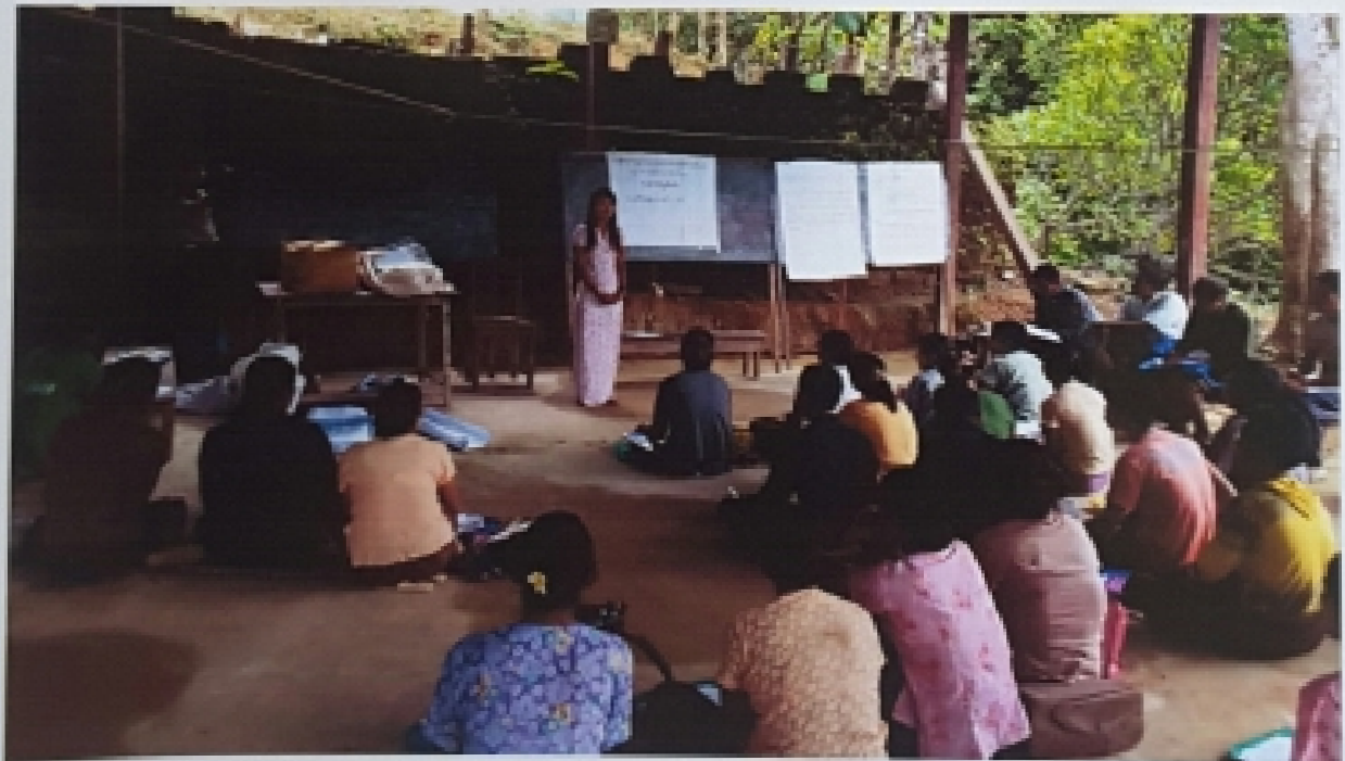
အောက်ရှင်းလက်ဝကျေးရွာ၊ ရှင်းလက်ဝကျေးရွာအုပ်စု ကျေးရွာလူထုအစည်းအဝေးမှတ်တမ်းတင်ပုံ