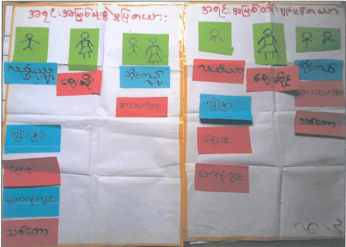
ပိုင်ဆိုင်မှုသုံးသပ်ခြင်းပြဿနာ သုံးသပ်ချက်

စေတနာကျေးရွာရှိ အရင်းအမြစ်များကိုသုံးစွဲရာတွင် အမျိုးသားများက လယ်ယာ၊ ကျွဲ၊ နွား၊ ချောင်း၊ ဘောလုံးကွင်း၊ သစ်တောများကို သုံးစွဲကြသည်။ အမျိုးသမီးများက ဈေးဆိုင်ကိုသားသုံးစွဲရပါသည်။ ဆိုင်ကယ်၊ စာသင်ကျောင်းများကိုတော့ အမျိုးသား/အမျိုးသမီးနှစ်ဦးလုံးတန်းတူညီမျှ သုံးစွဲကြသည်။ အမျိုးသားများက ခွန်အားကြီးမာသောကြောင့် ကျေးရွာ၏အရင်းအမြစ်များကို အများဆုံးသုံးစွဲကြပါသည်။