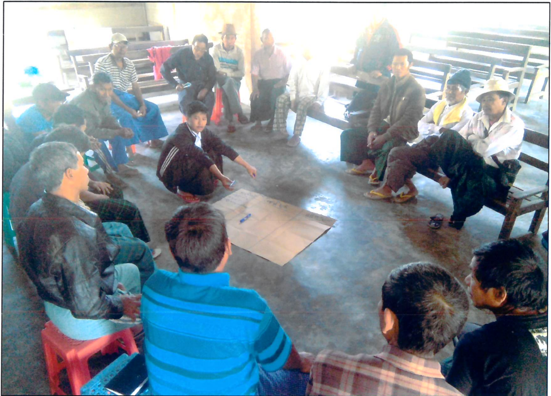
နန့်.ဟိုင်အုပ်စု၊ စေတုံကျေးရွာ PRA Tools များရေးဆွဲနေပုံ