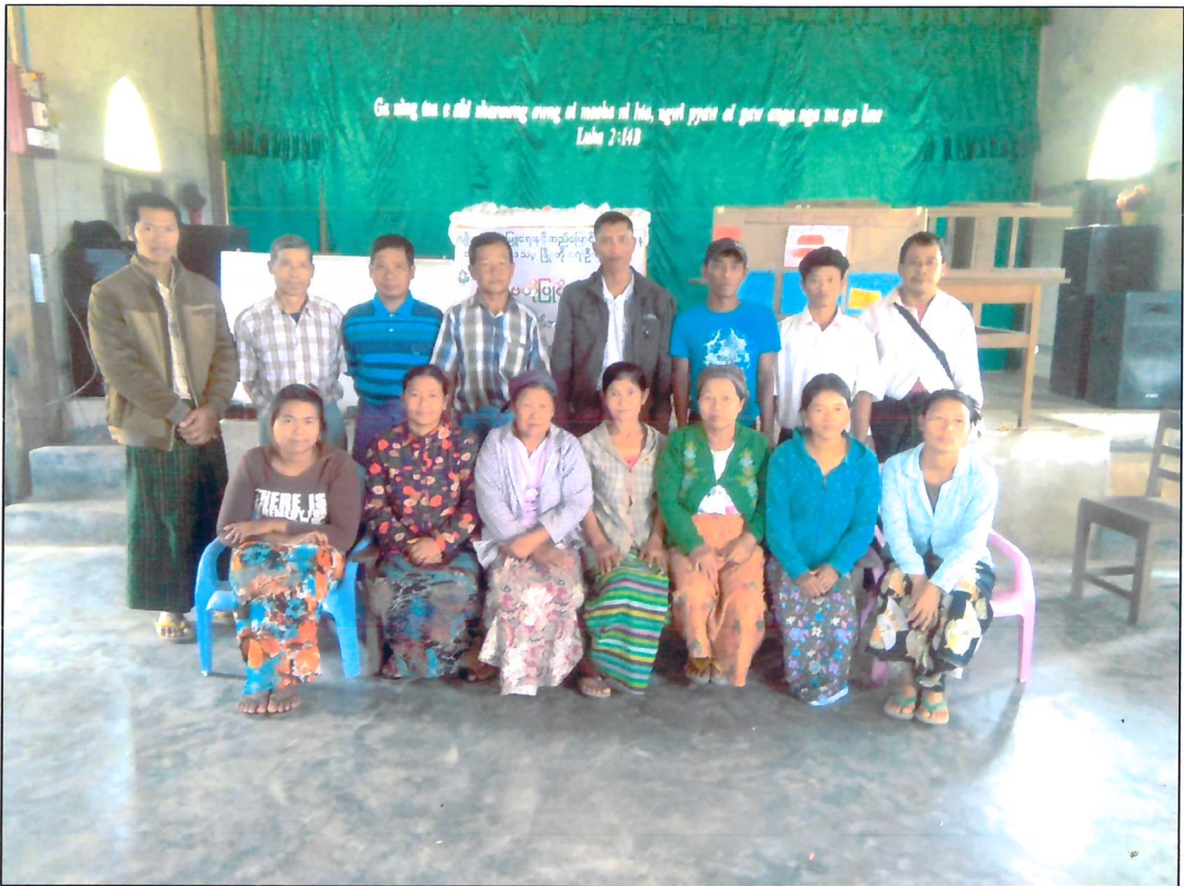
နန့်.ဟိုင်အုပ်စု၊ စေတုံကျေးရွာ ကော်မတီဝင်များ