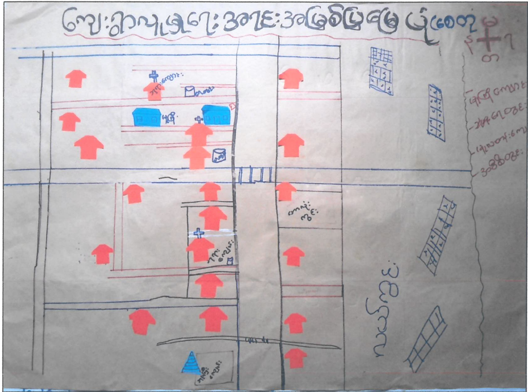
လူမှုရေးနှင့်အရင်းအမြစ်ပြမြေပုံ သုံးသပ်ချက်