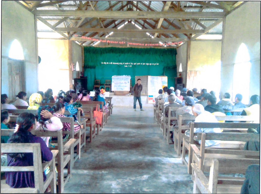
နန့်.ဟိုင်အုပ်စု၊ စေတုံကျေးရွာ စီမံကိန်းမိတ်ဆက်အစည်းအဝေး