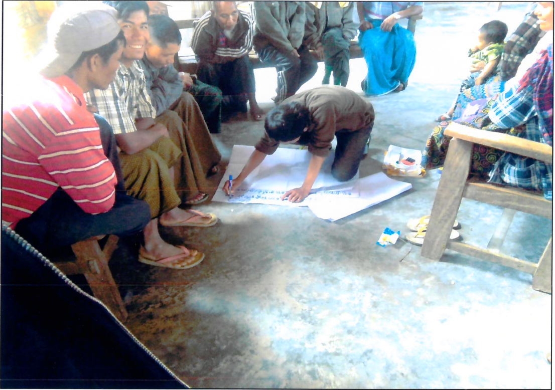
နန့်.ဟိုင်အုပ်စု၊ စေတုံကျေးရွာ PRA Tools များရေးဆွဲနေပုံ