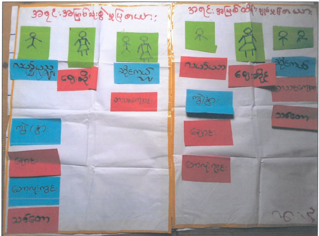
ပိုင်ဆိုင်မှုသုံးသပ်ခြင်းပြဇယား သုံးသပ်ချက်

လဘန်ကထောင်ကျေးရွာရှိ အရင်းအမြစ်များကိုသုံးစွဲရာတွင် အမျိုးသားများက လယ်ယာ၊ ကျွဲ၊ နွား၊ ချောင်း၊ ဘောလုံးကွင်း၊ သစ်တောများကို သုံးစွဲကြသည်။ အမျိုးသမီးများက ဈေးဆိုင်ကိုသားသုံးစွဲရပါသည်။ ဆိုင်ကယ်၊ စာသင်ကျောင်းများကိုတော့ အမျိုးသား/အမျိုးသမီးနှစ်ဦးလုံးတန်းတူညီမျှ သုံးစွဲကြသည်။ အမျိုးသားများက ခွန်အားကြီးမာသောကြောင့် ကျေးရွာ၏အရင်းအမြစ်များကို အများဆုံးသုံးစွဲကြပါသည်။