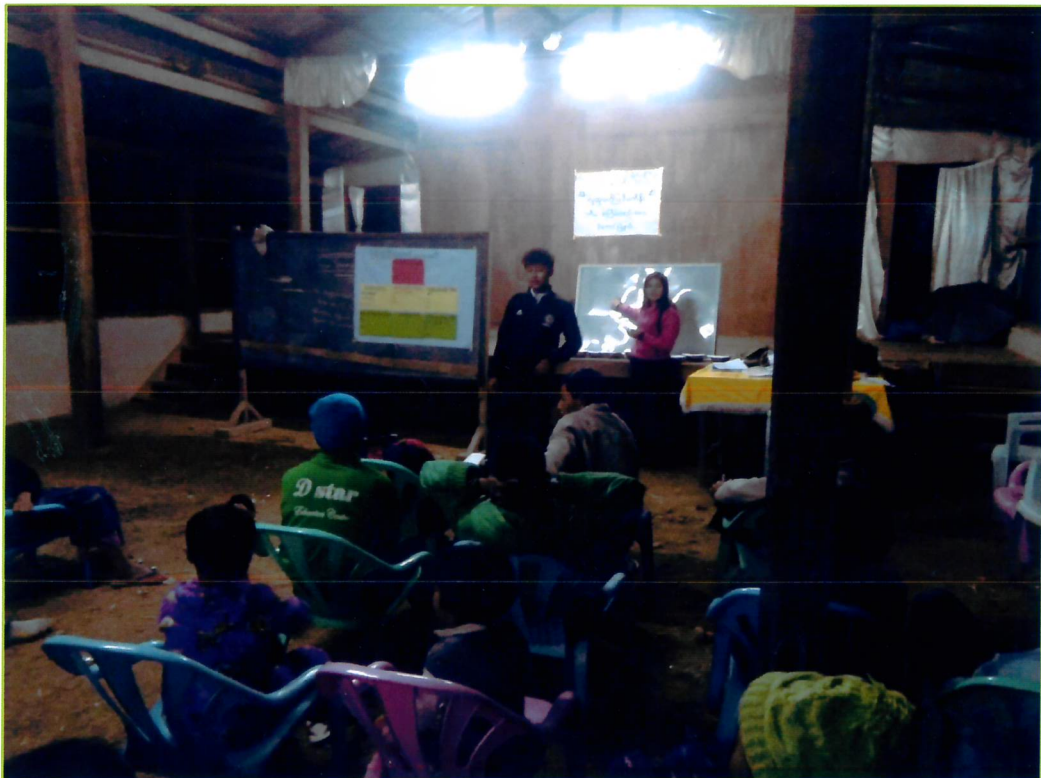
နန့်.ဟိုင်အုပ်စု၊ လဘန်ကထောင်ကျေးရွာ ပထမနေ့စီမံကိန်းမိတ်ဆက် အစည်းအဝေး