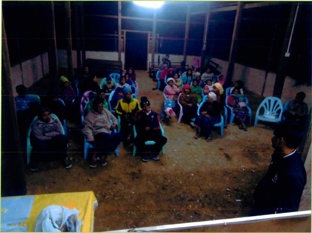
နန့်.ဟိုင်အုပ်စု၊ လဘန်ကထောင်ကျေးရွာ ပထမနေ့စီမံကိန်းမိတ်ဆက် အစည်းအဝေး