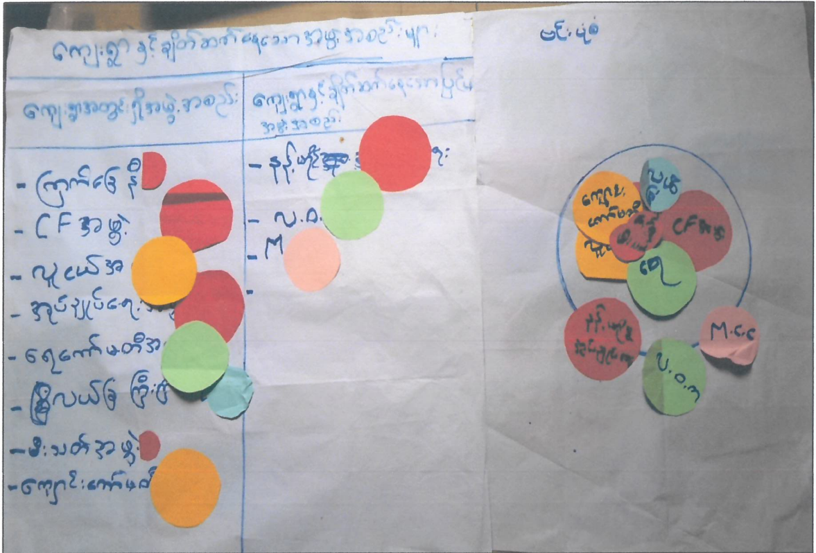
ဗင်းပုံစံ သုံးသပ်ချက်

လာန်ကထောင်ကျေးရွာအတွင်းရှိ အဖွဲ့အစည်းများမှာ ကြက်ခြေနီ၊ CFအဖွဲ့၊ လူငယ်အဖွဲ့၊ အုပ်ချုပ်ရေးအဖွဲ့၊ ရေကော်မတီ၊ လယ်ခြံကြီးကြပ်ရေးအဖွဲ့၊ မီးသတ်အဖွဲ့နှင့် ကျောင်းကျောင်းကော်မတီတို့ဖြစ်၍ ရွာနှင့်ချိတ်ဆက်နေသော ပြင်ပအဖွဲ့များမှာ နန်ဟိုင်အုပ်ချုပ်ရေး လ.ဝ.ကနှင့် M.C.C.တို့ဖြစ်ပါသည်။ အုပ်ချုပ်ရေးအဖွဲ့တို့သည်အစိုးရမှ အသိအမှတ်ပြုထားသောအဖွဲ့ဖြစ်သည့် လူငယ်အဖွဲ့၊ ကျောင်းကျောင်းကော်မတီအဖွဲ့နှင့်ရေကော်မတီအဖွဲ့တို့သည် ကျေးရွာလိုအပ်ချက်အရ ဖွဲ့စည်းထားသောအဖွဲ့ဖြစ်သည်။ နှစ်ရှည်သစ်ပင်စီမံကိန်း CFအဖွဲ့မှာ အဓိကကူညီပံ့ပိုးလျက်ရှိ ပါသည်။