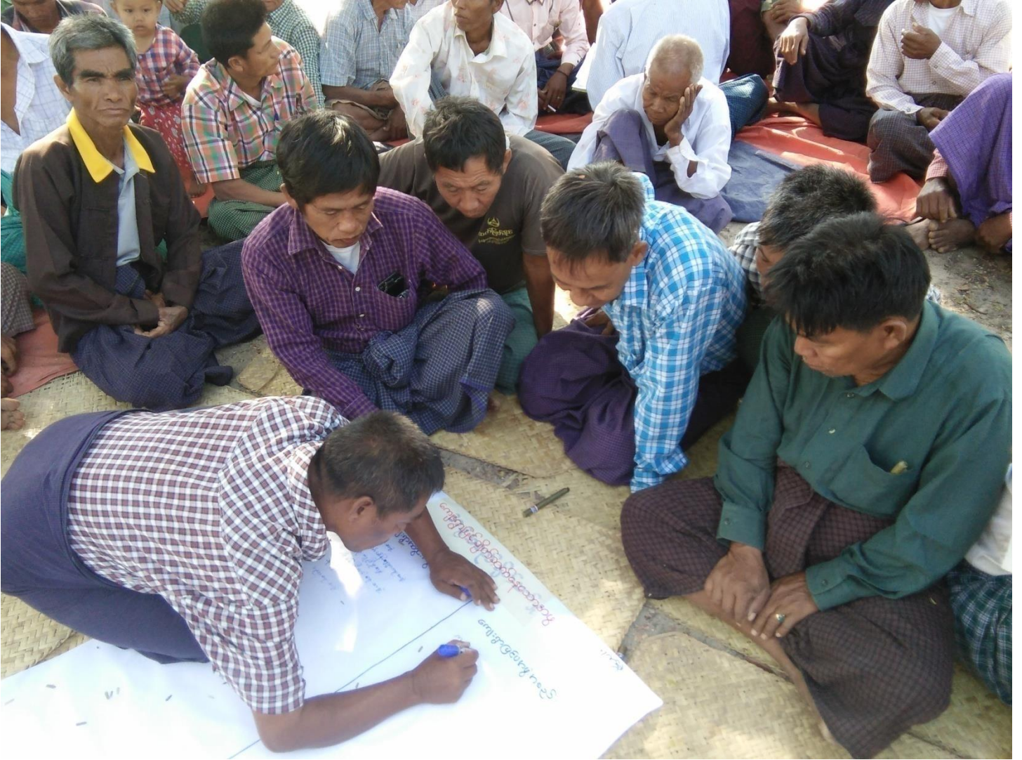
ကျေးရွာသူ၊ ကျေးရွာသားများအဖွဲ့အစည်းချိတ်ဆက်မှုပြ မြေပုံရေးဆွဲနေပုံ