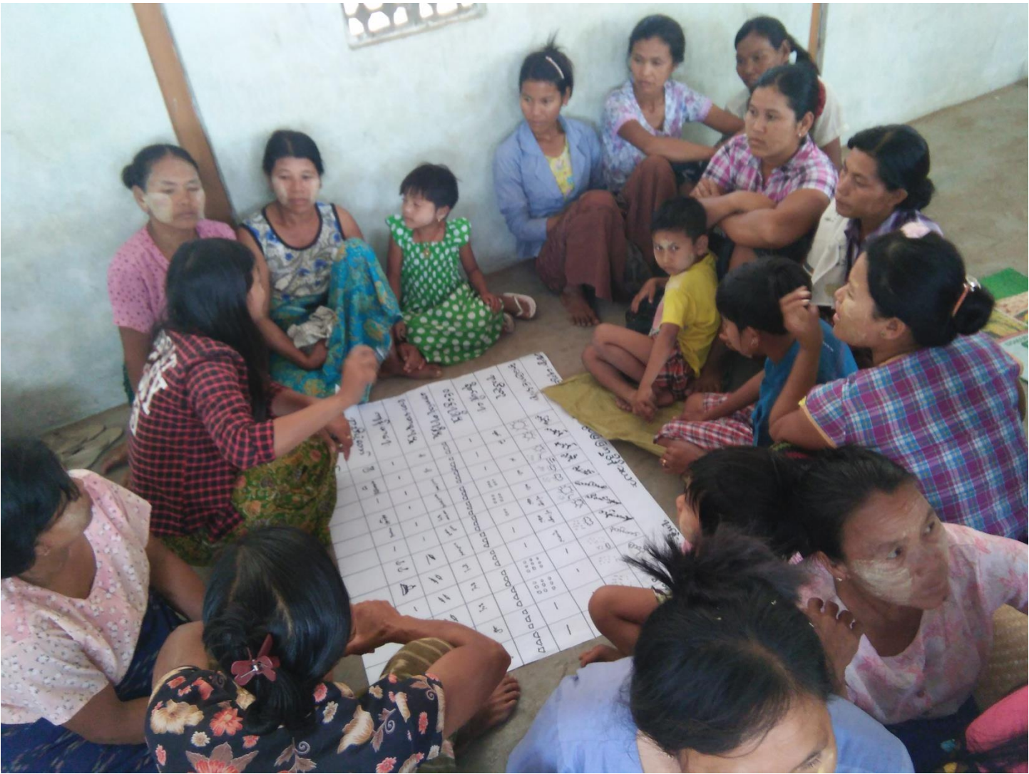
ကျေးရွာသူ၊ ကျေးရွာသားများရာသီခွင်ပြုပြင်ပေးရေးဆွဲနေပုံ