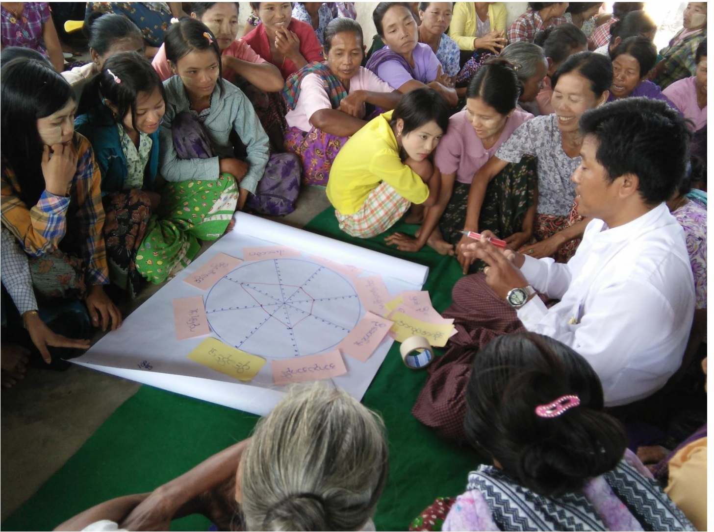
ကျေးရွာသူ၊ ကျေးရွာသားများပင့်ကူအိမ်သုံးသပ်ချက်ပြဇယားရေးဆွဲနေပုံ