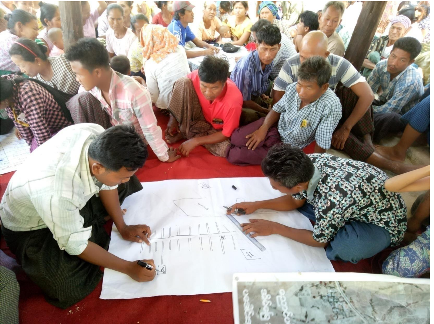
ကျေးရွာသူ၊ ကျေးရွာသားများကျေးရွာလူမှုရေးနှင့် အရင်းအမြစ်ပြုမြေပုံရေးဆွဲနေစဉ်