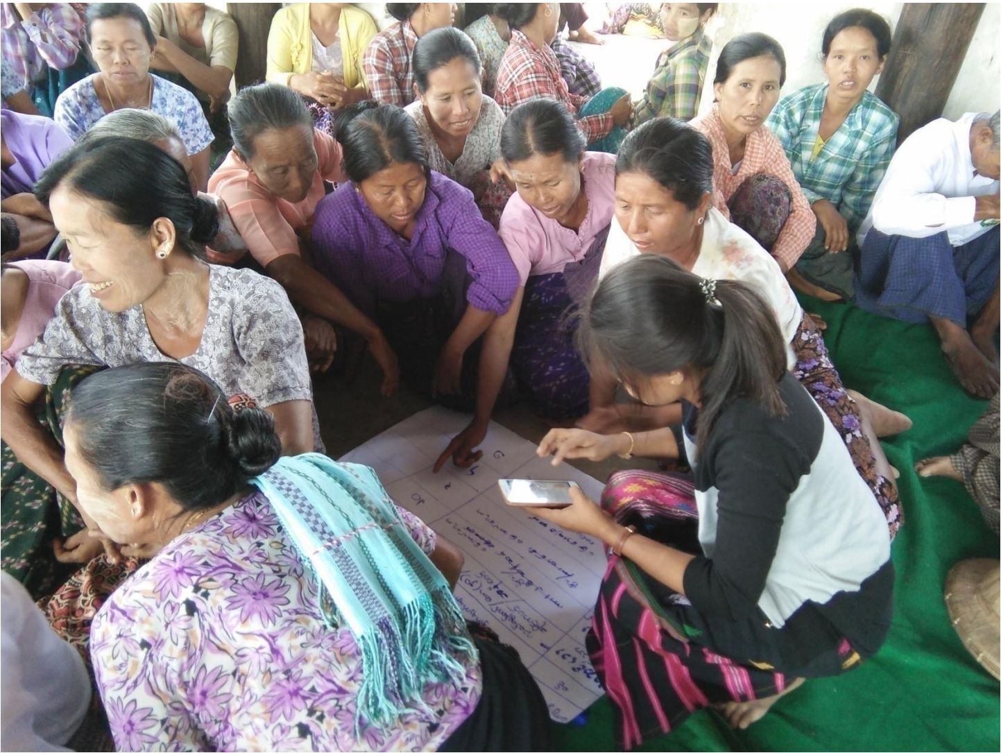
ကျေးရွာသူ၊ ကျေးရွာသားများဥစ္စာနေကြွယ်ဝမှုပြဇယားရေးဆွဲနေပုံ