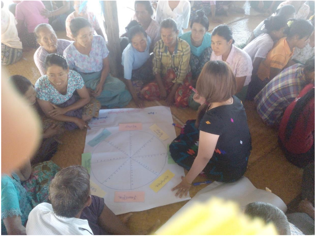
ကျေးရွာသူ၊ ကျေးရွာသားများပင့်ကူအိမ်သုံးသပ်ချက်ပြဇယားရေးဆွဲနေပုံ