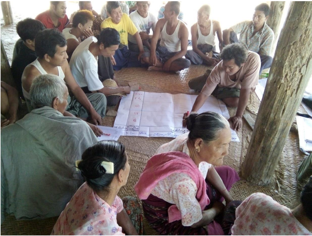
ကျေးရွာသူ၊ ကျေးရွာသားများညွှန်ကြားရေးအဖွဲ့ဝင်များအား ရေးဆွဲနေပုံ