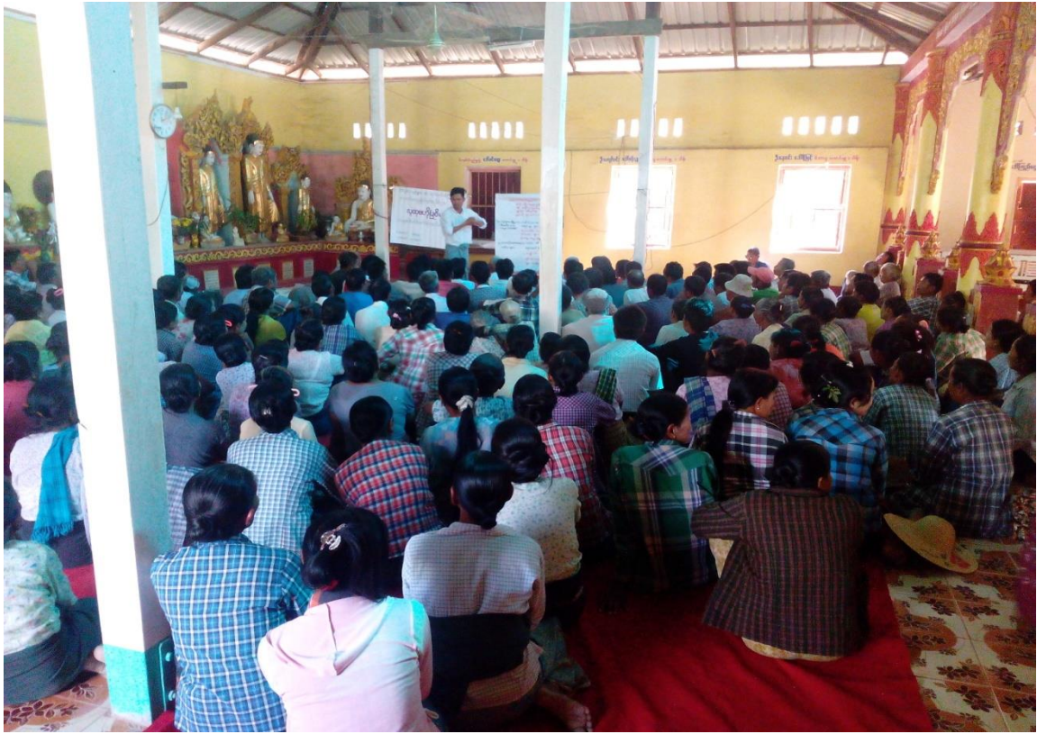
ကျေးရွာသူ၊ ကျေးရွာသားများကျေးရွာလူမှုရေးနှင့် အရင်းအမြစ်ပြုပြင်ရေးဆွဲနေစဉ်