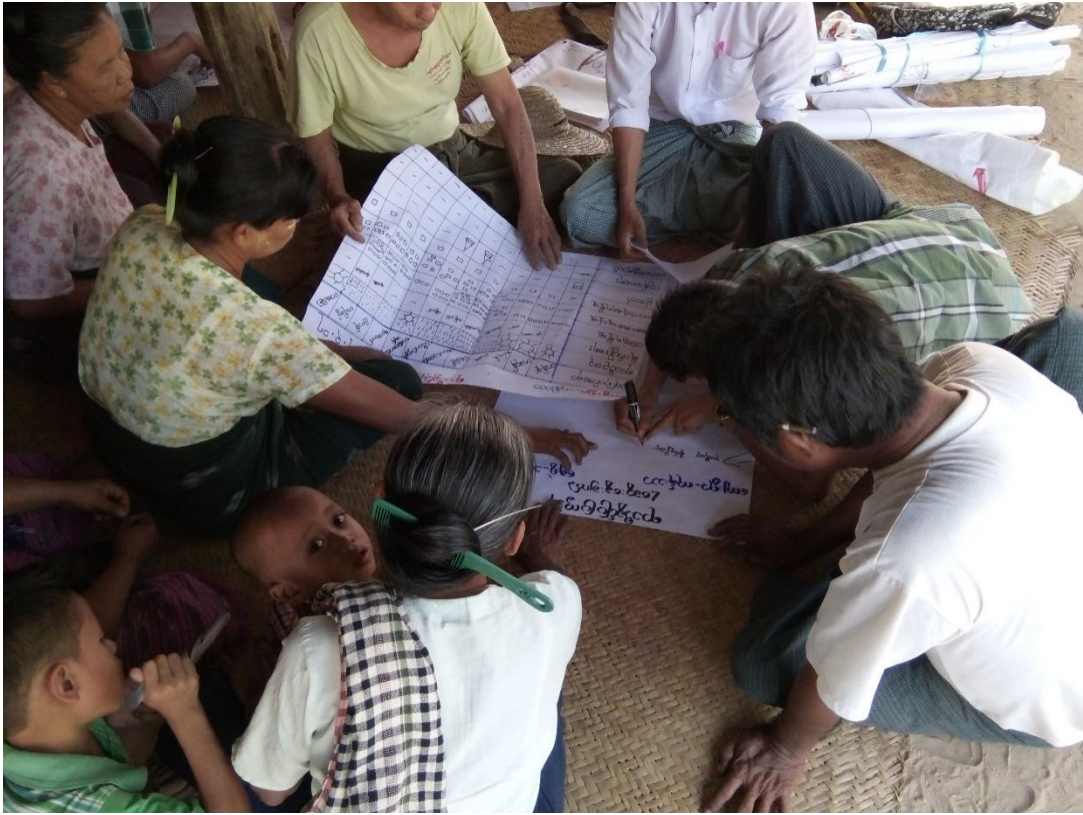
ကျေးရွာသူ၊ ကျေးရွာသားများရာသီခွင်ပြုပြင်ကွဲအိန်ရေးဆွဲနေပုံ