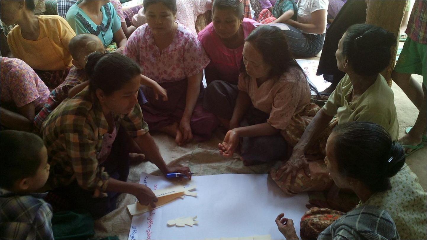
ကျေးရွာသူ၊ ကျေးရွာသားများအရင်းအမြစ် သုံးစွဲမှုနှင့် ထိန်းချုပ်မှုပြဇယားရေးဆွဲနေပုံ