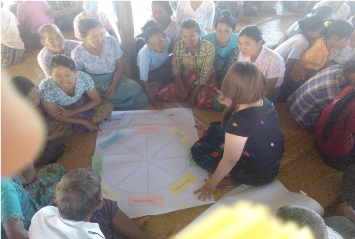
ကျေးရွာသူ၊ ကျေးရွာသားများအဖွဲ့အစည်းချိတ်ဆက်မှုပြ မြေပုံရေးဆွဲနေပုံ