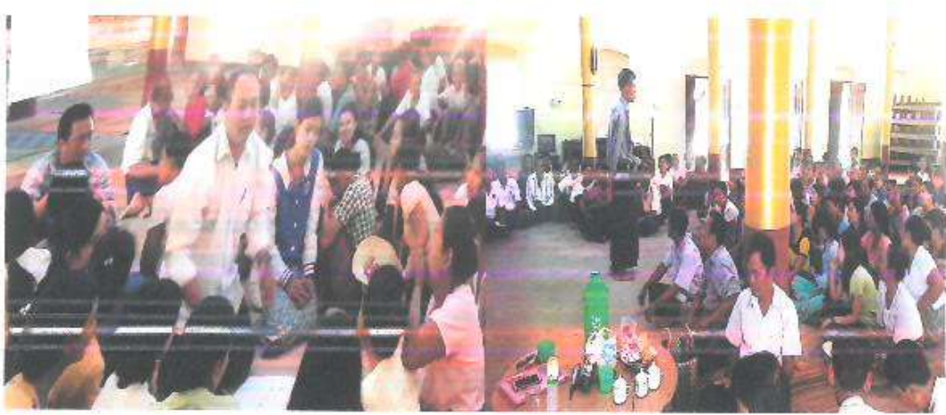
၇။ ကော်မတီဝင်များ ရွေးချယ်ခြင်းနှင့် ကျေးရွာဖွံ့ဖြိုးရေးအဖွဲ့အစည်းဆောင်ရွက်မှု မှတ်တမ်းဓာတ်ပုံများ