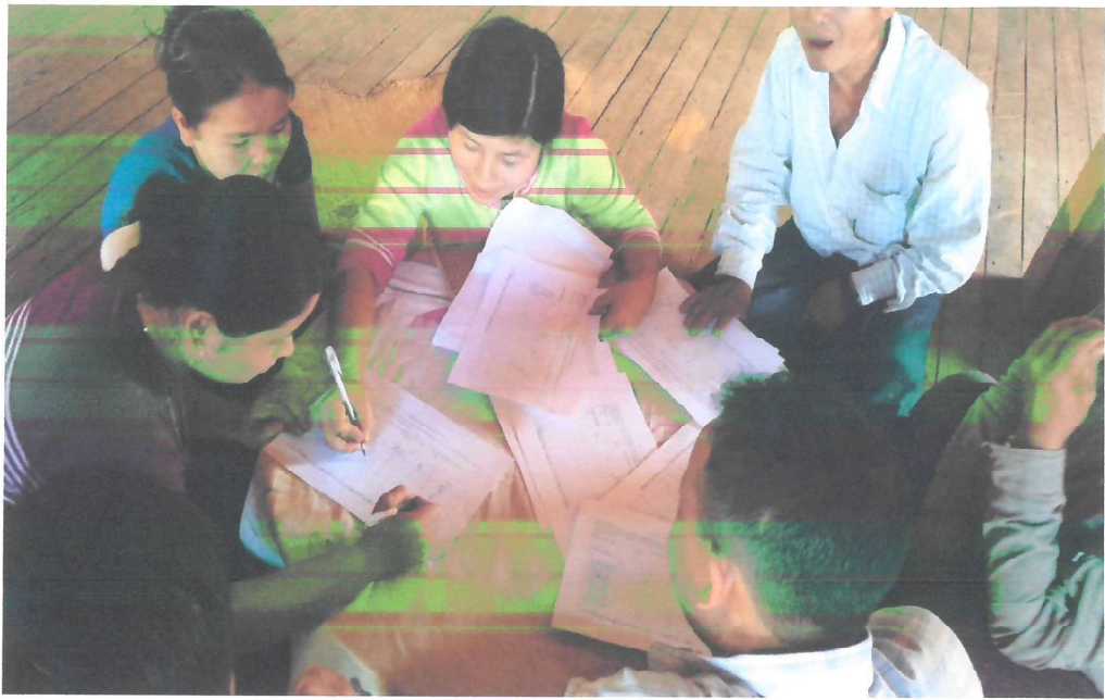
လူထုပူးပေါင်းပါဝင်နေပုံ