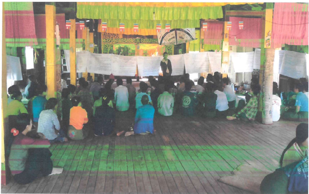
လူထုပူးပေါင်းပါဝင်နေပုံ