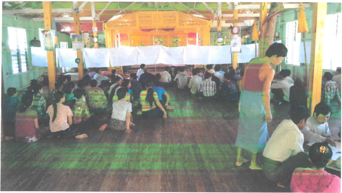
လူထုပူးပေါင်းပါဝင်နေပုံ