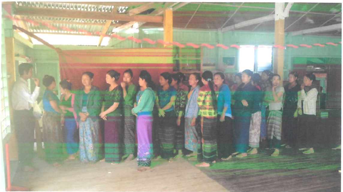
လူထုပူးပေါင်းပါဝင်နေပုံ