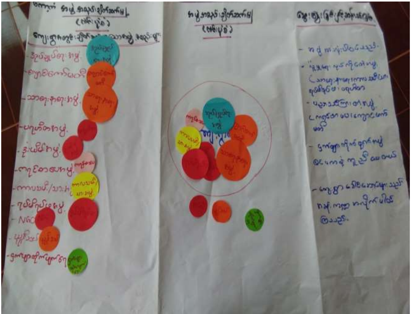
အုန်းတပင်ကျေးရွာအုပ်စု၊ ကော့ကံကျေးရွာ