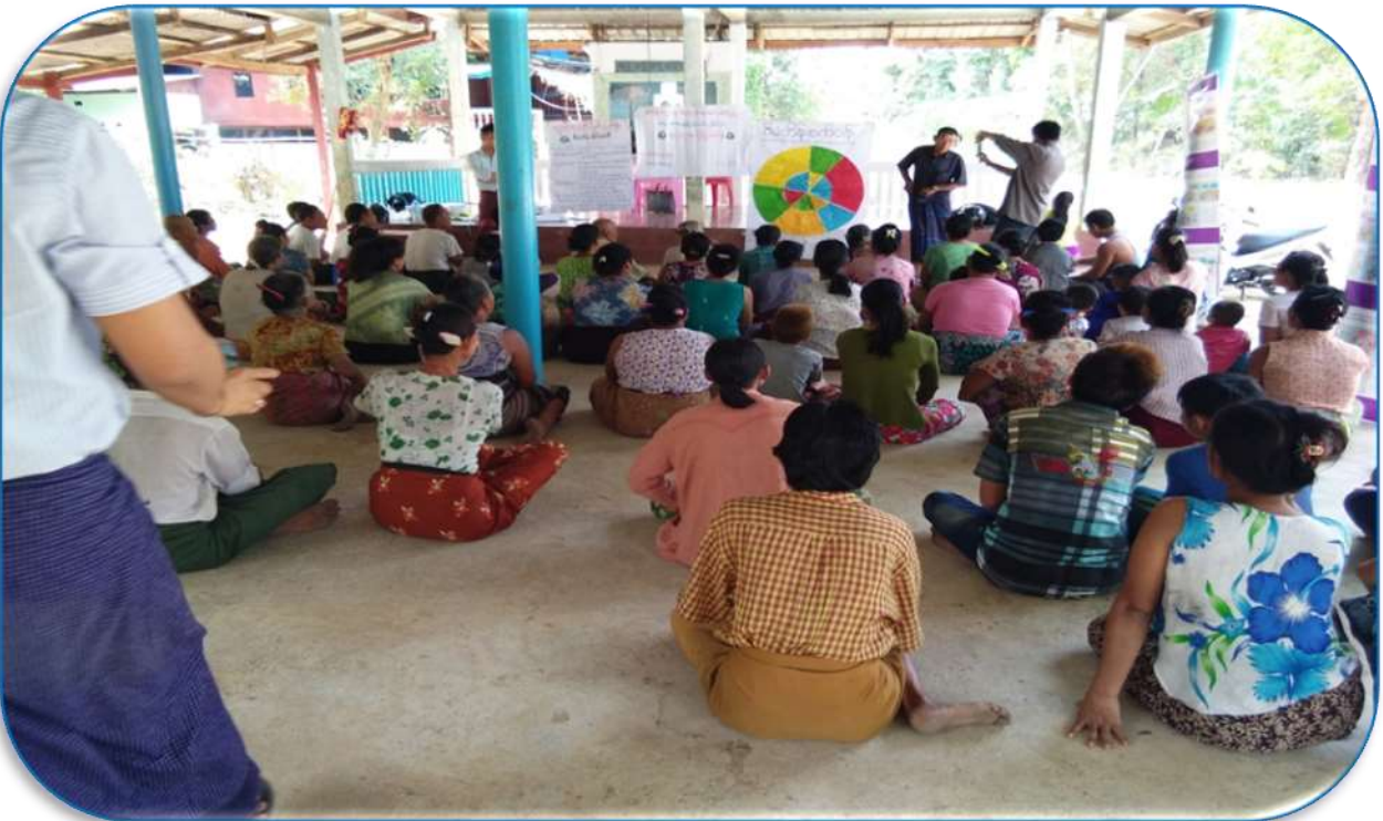
အုန်းတပင်ကျေးရွာအုပ်စု၊ကော့ကံကျေးရွာ