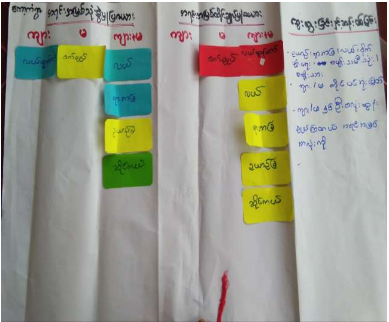
အုန်းတပင်ကျေးရွာအုပ်စု၊ ကော့ကံကျေးရွာ