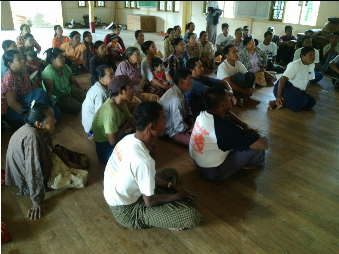
စေတနာ့ဝန်ထမ်းများ ရွေးချယ်ခြင်း မှတ်တမ်းဓာတ်ပုံ