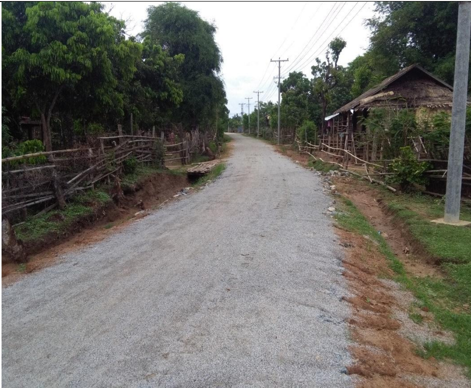
တတိယနှစ်စီမံကိန်းလုပ်ငန်းခွဲဆောင်ရွက်ပြီးစီးမှုမှတ်တမ်းဓာတ်ပုံ