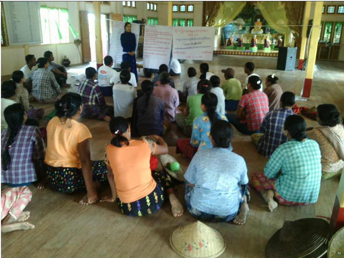
ကော်မတီရွေးချယ်ခြင်း မှတ်တမ်းဓာတ်ပုံ