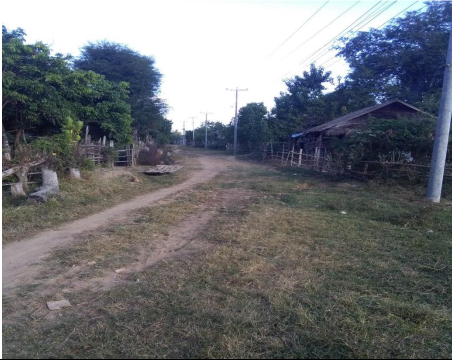
တတိယနှစ်စီမံကိန်းလုပ်ငန်းခွဲဆောင်ရွက်မှီမှတ်တမ်းဓာတ်ပုံ