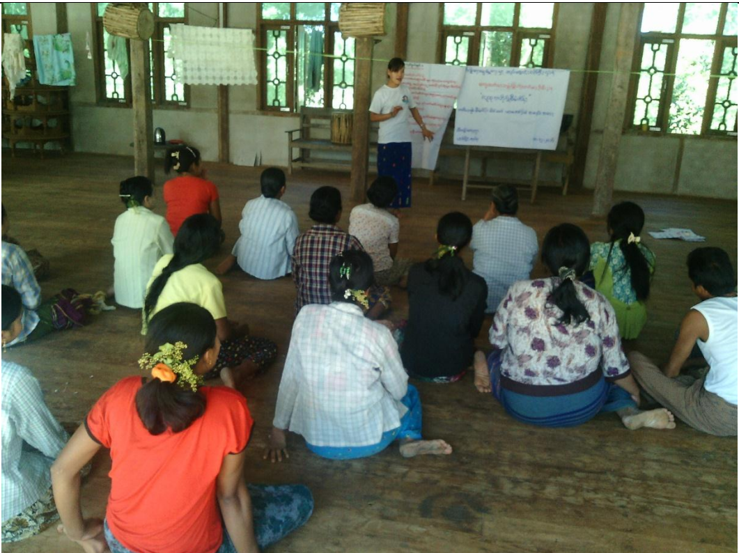
ကော်မတီရွေးချယ်ခြင်း မှတ်တမ်းဓါတ်ပုံ