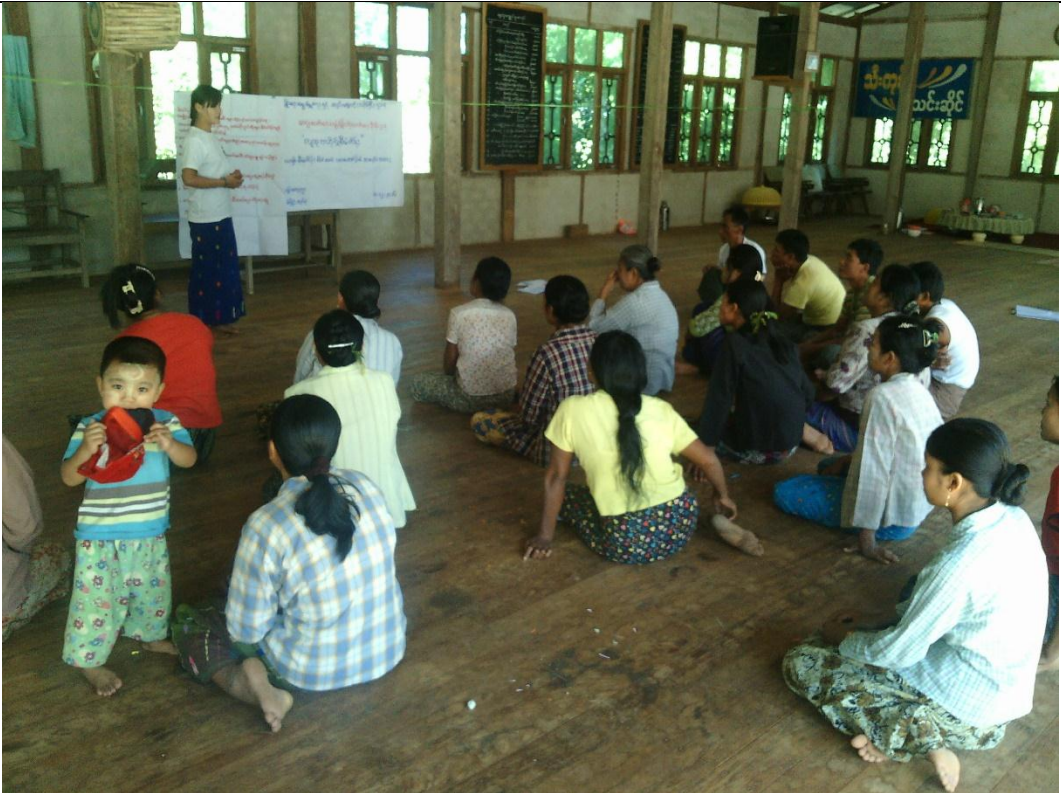
စေတနာ့ဝန်ထမ်းများ ရွေးချယ်ခြင်း မှတ်တမ်းဓါတ်ပုံ