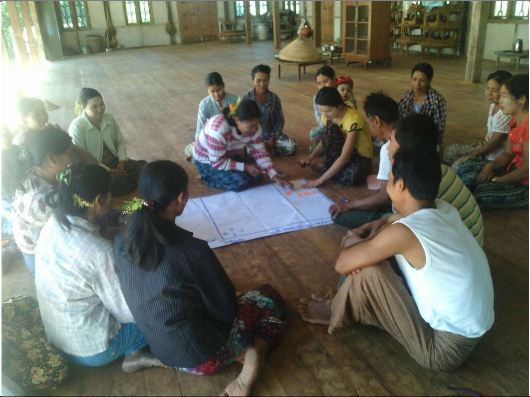
လူငယ်အုပ်စု၏ မှတ်တမ်းခါတ်ပုံ