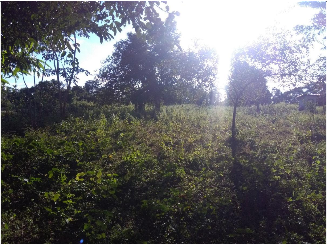
တတိယနှစ်စီမံကိန်းလုပ်ငန်းခွဲဆောင်ရွက်ပြီးစီးမှုမှတ်တမ်းဓာတ်ပုံ