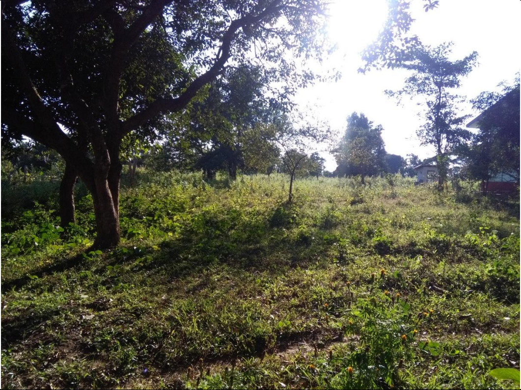
တတိယနှစ်စီမံကိန်းလုပ်ငန်းခွဲဆောင်ရွက်မီမှတ်တမ်းဓာတ်ပုံ