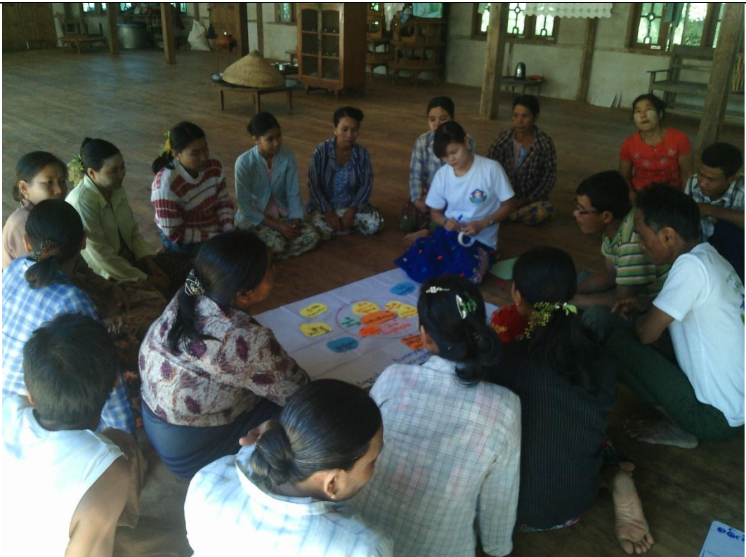
အမျိုးသမီးအုပ်စု၏ မှတ်တမ်းခါတ်ပုံ