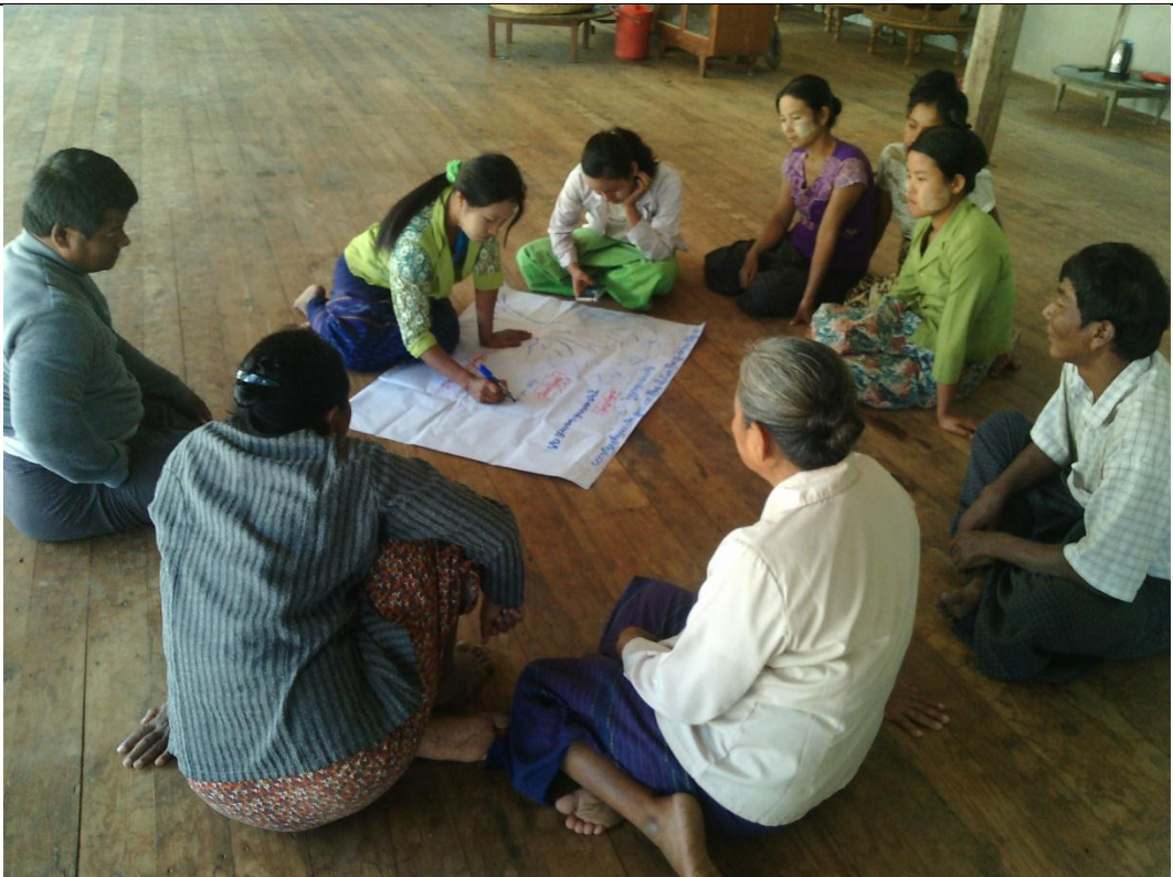
ထိခိုက်လွယ်အုပ်စုများ၏ မှတ်တမ်းခါတ်ပုံ