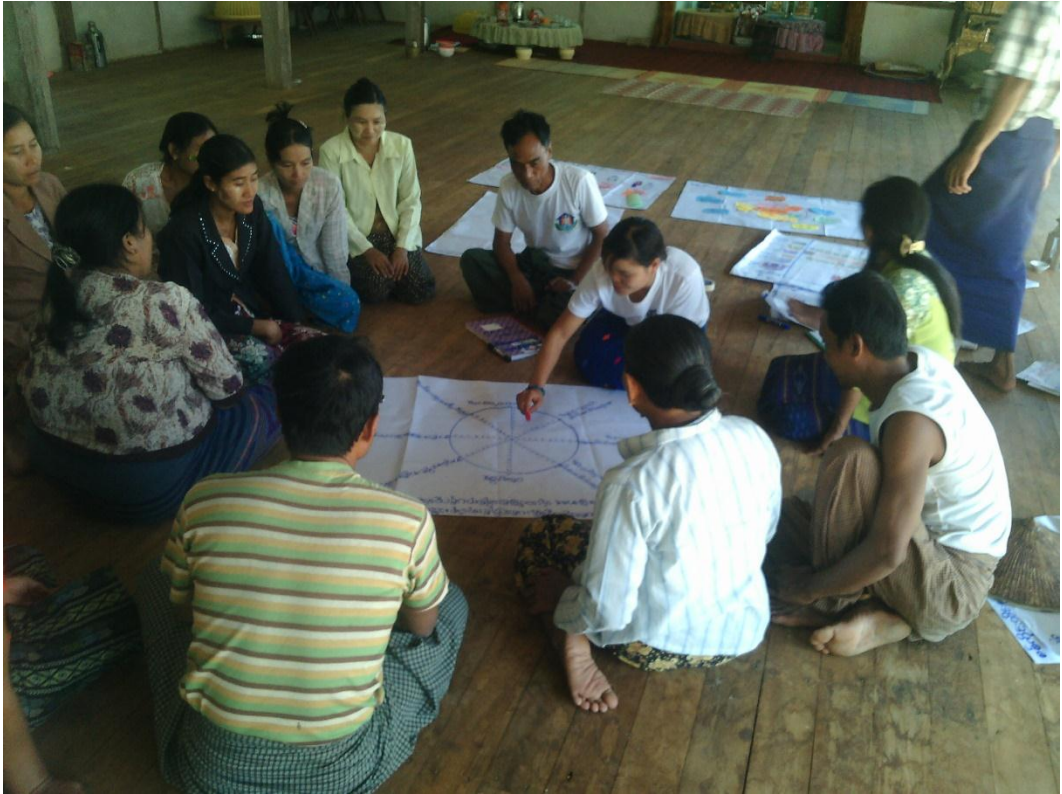
အမျိုးသား/အမျိုးသမီးအုပ်စု၏ မှတ်တမ်းခါတ်ပုံ