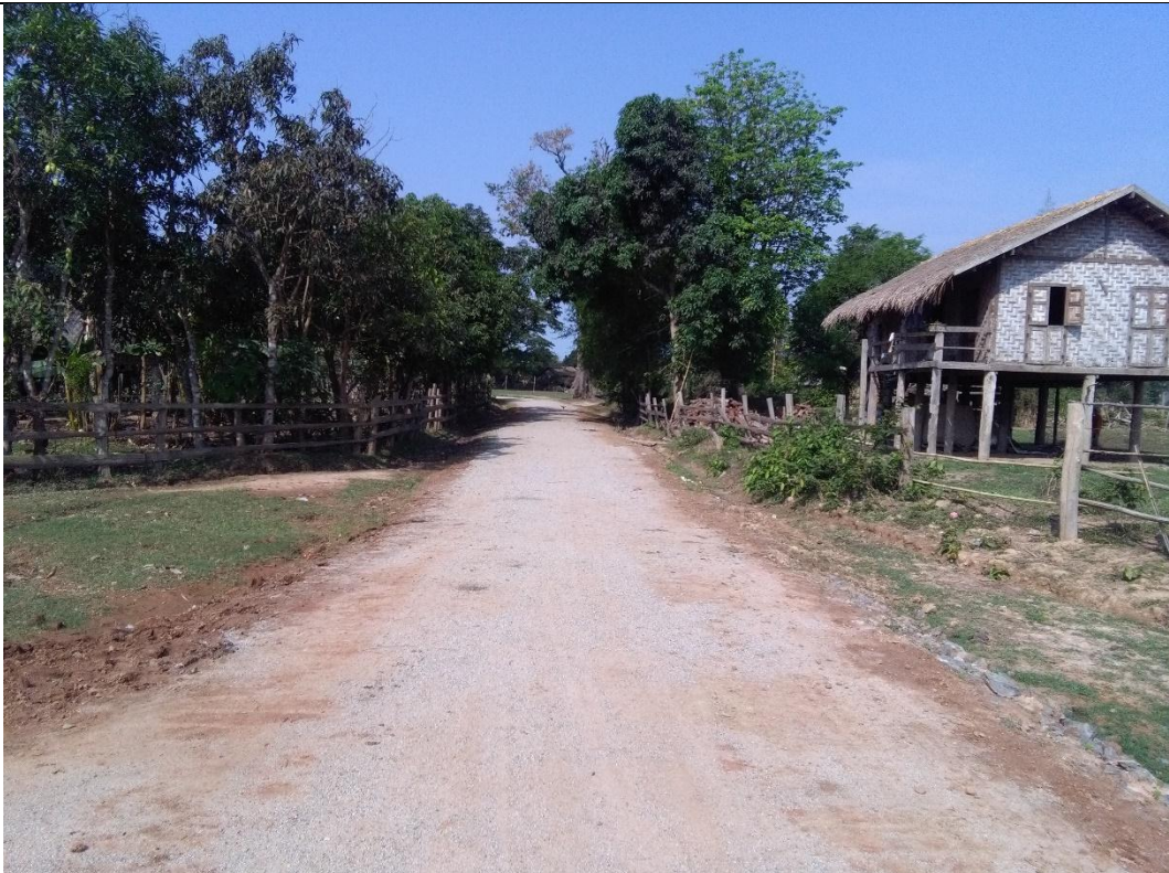
တတိယနှစ်စီမံကိန်းလုပ်ငန်းခွဲဆောင်ရွက်ပြီးစီးမှုမှတ်တမ်းဓာတ်ပုံ