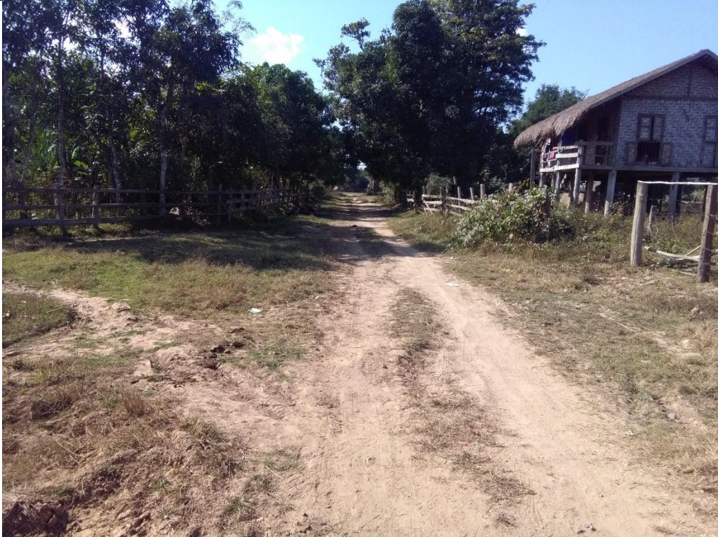
တတိယနှစ်စီမံကိန်းလုပ်ငန်းခွဲဆောင်ရွက်မီမှတ်တမ်းဓာတ်ပုံ