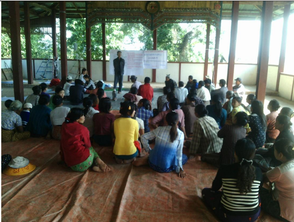
ကော်မတီရွေးချယ်ခြင်း မှတ်တမ်းဓါတ်ပုံ