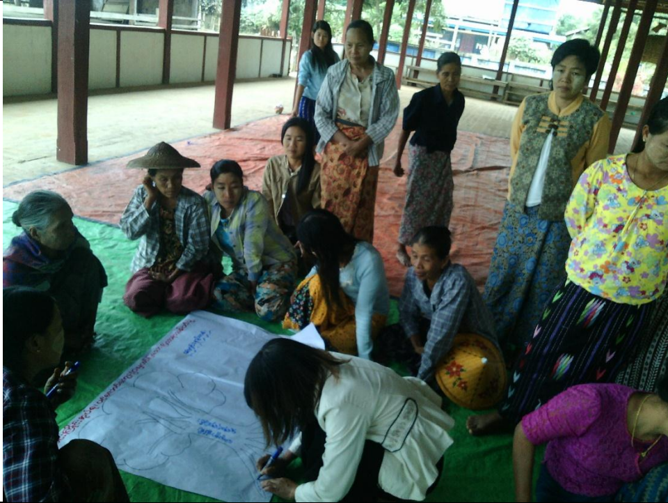
ဖွံ့ဖြိုးရေးအစီအစဉ်ရေးဆွဲခြင်း မှတ်တမ်းဓာတ်ပုံ