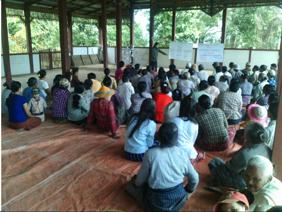
စေတနာ့ဝန်ထမ်းများ ရွေးချယ်ခြင်း မှတ်တမ်းဓါတ်ပုံ