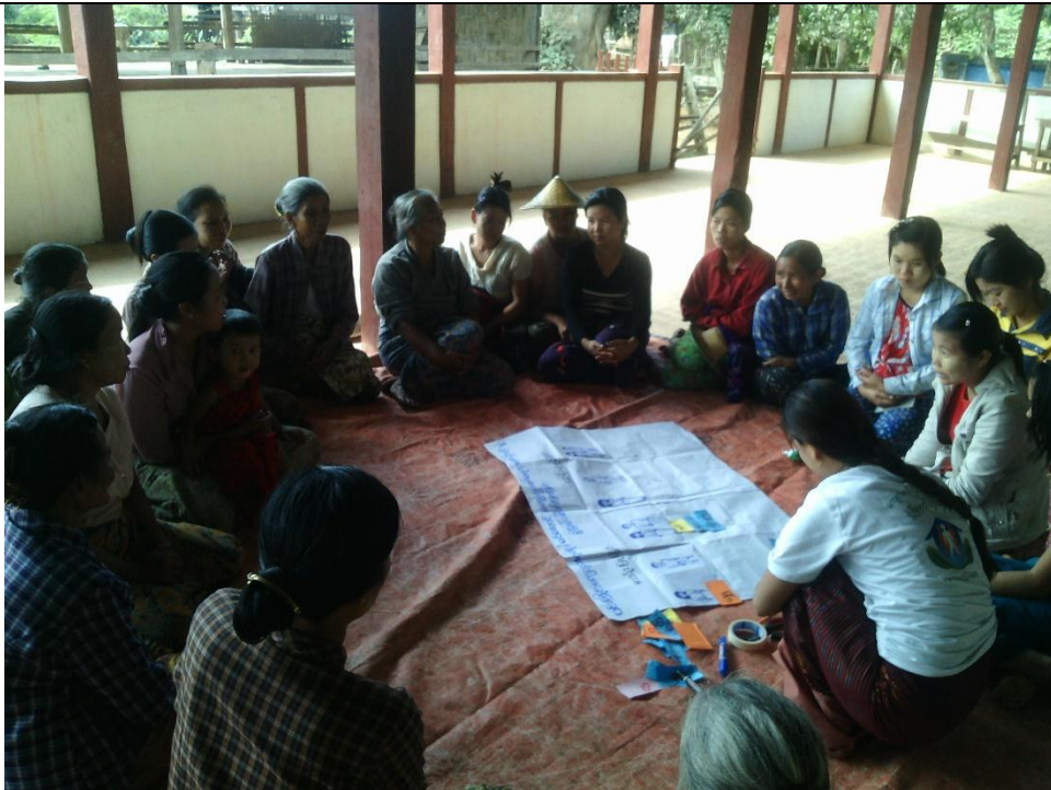
ထိခိုက်လွယ်အုပ်စုများ၏ မှတ်တမ်းခါတ်ပုံ