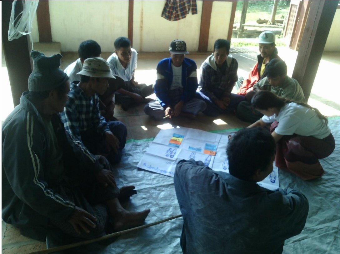
အမျိုးသားအုပ်စု၏ မှတ်တမ်းခါတ်ပုံ