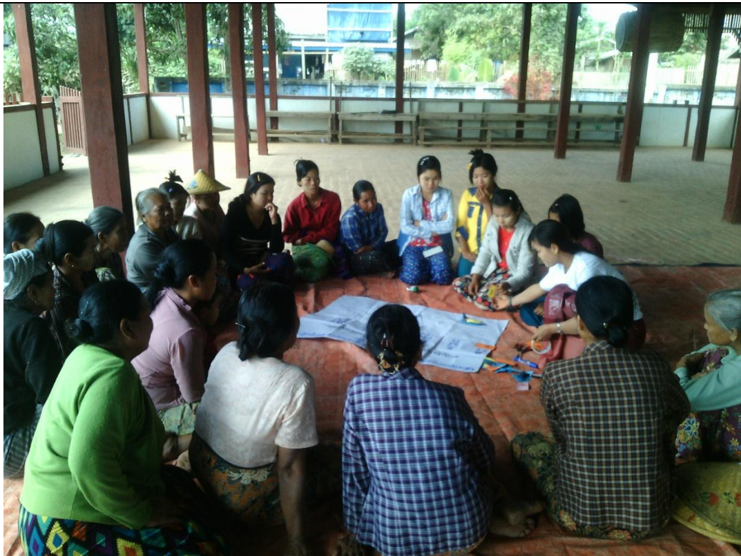
အမျိုးသမီးအုပ်စု၏ မှတ်တမ်းခါတ်ပုံ