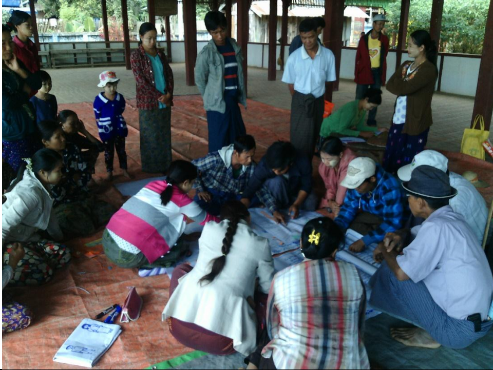
လူငယ်အုပ်စု၏ မှတ်တမ်းခါတ်ပုံ