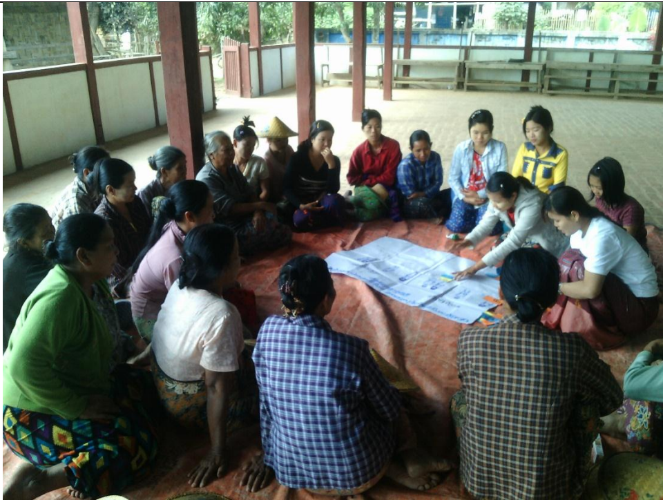
ဖွံ့ဖြိုးရေးအစီအစဉ်ရေးဆွဲခြင်း မှတ်တမ်းဓာတ်ပုံ