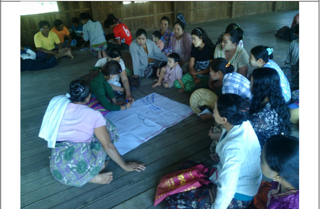
အမျိုးသမီးအုပ်စု၏ မှတ်တမ်းဓါတ်ပုံ