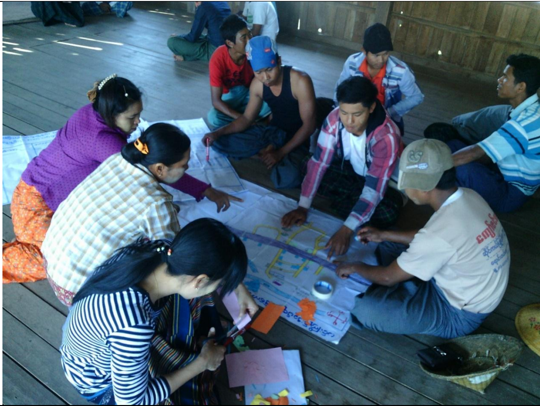
ဖွံ့ဖြိုးရေးအစီအစဉ်ရေးဆွဲခြင်း မှတ်တမ်းခတ်ပုံ