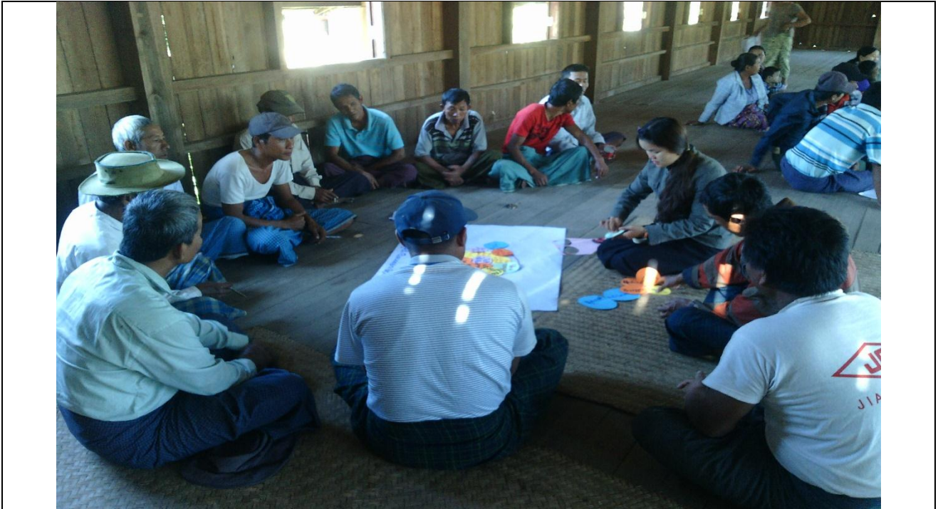
အမျိုးသားအုပ်စု၏ မှတ်တမ်းဓါတ်ပုံ