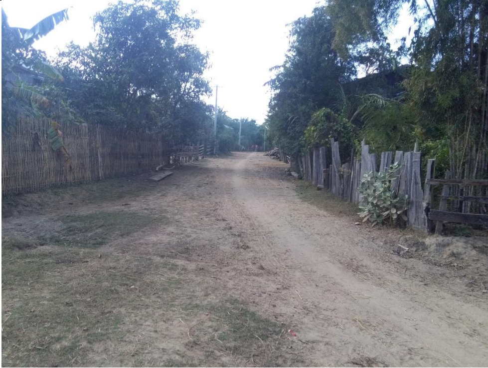
တတိယနှစ်စီမံကိန်းလုပ်ငန်းခွဲဆောင်ရွက်မီမှတ်တမ်းဓာတ်ပုံ