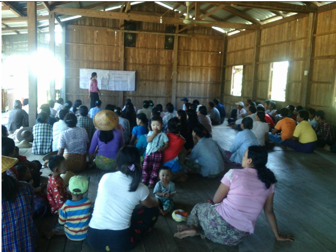
ကော်မတီရွေးချယ်ခြင်း မှတ်တမ်းခါတ်ပုံ