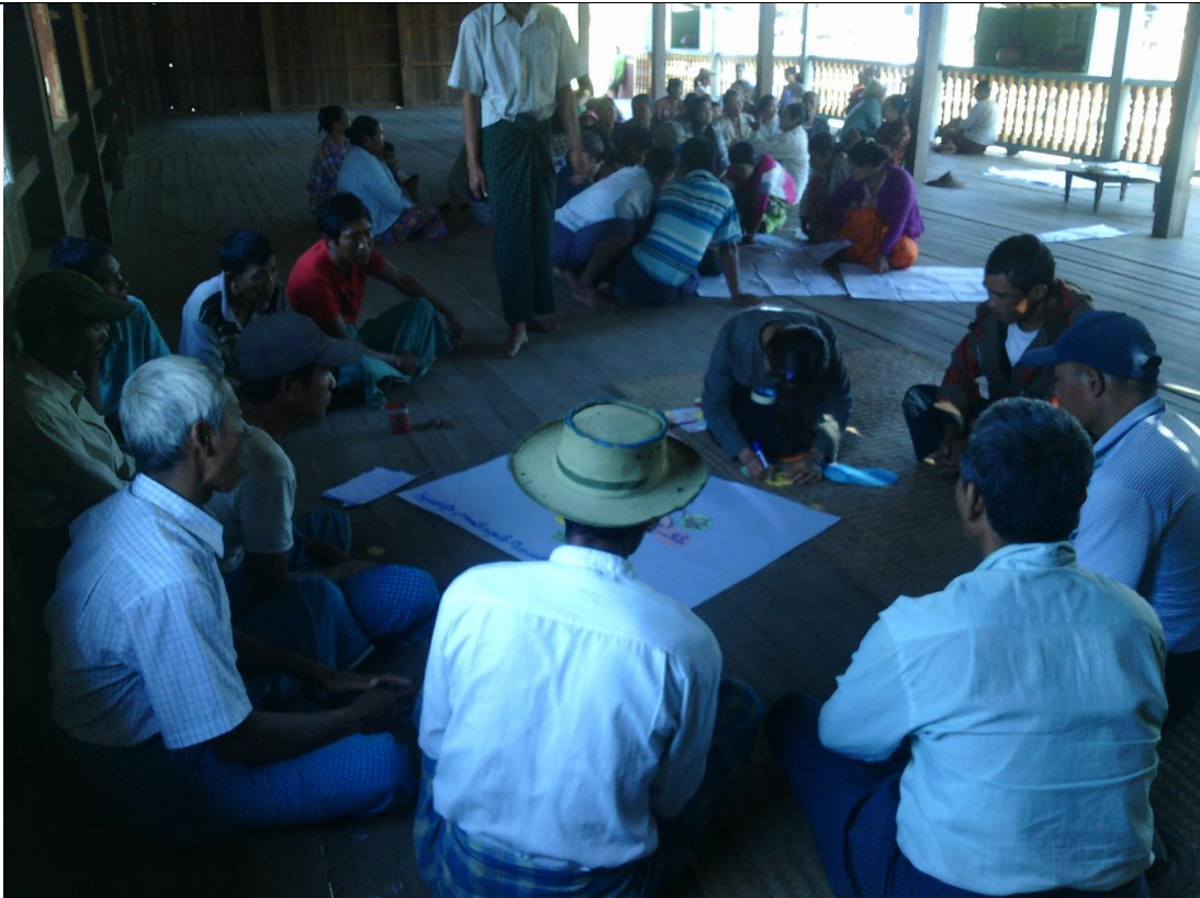
ထိခိုက်လွယ်အုပ်စုများ၏ မှတ်တမ်းခါတ်ပုံ