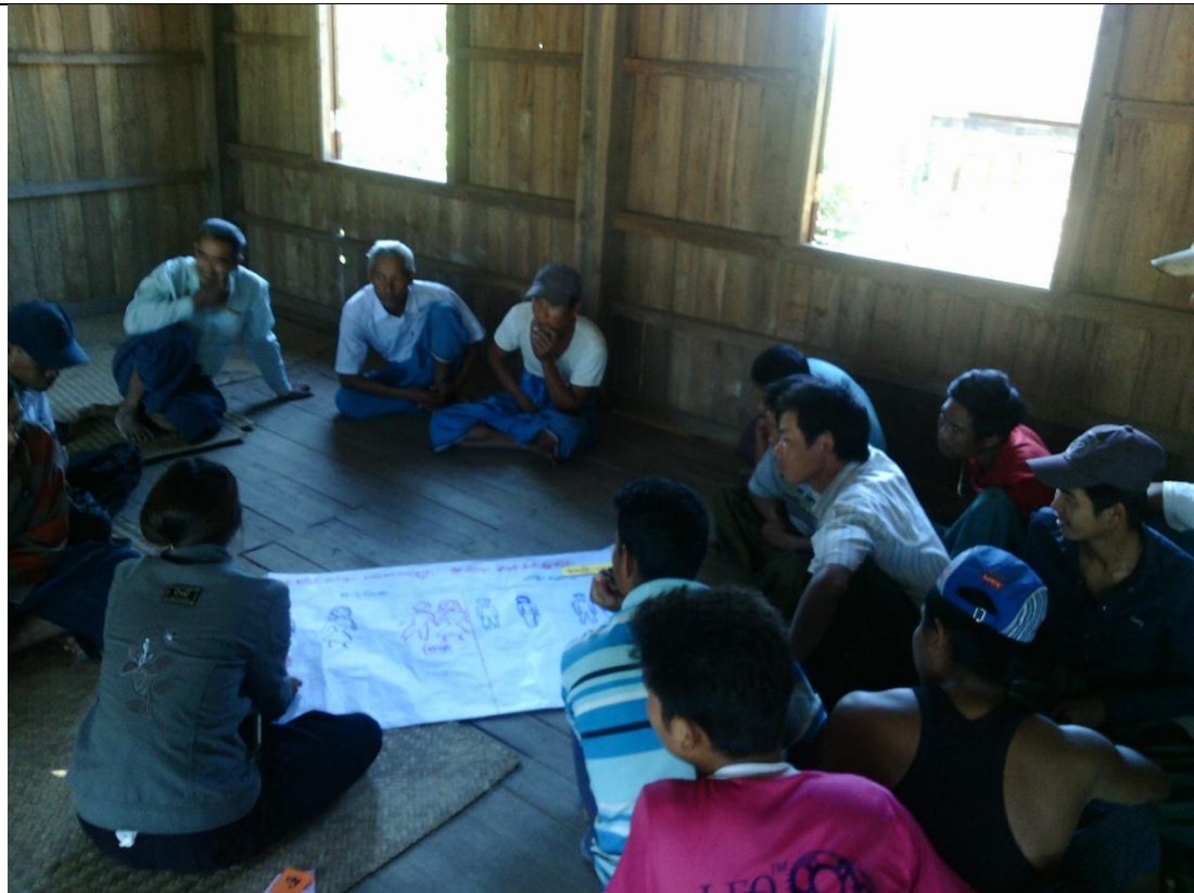
ဖွံ့ဖြိုးရေးအစီအစဉ်ရေးဆွဲခြင်း မှတ်တမ်းခတ်ပုံ