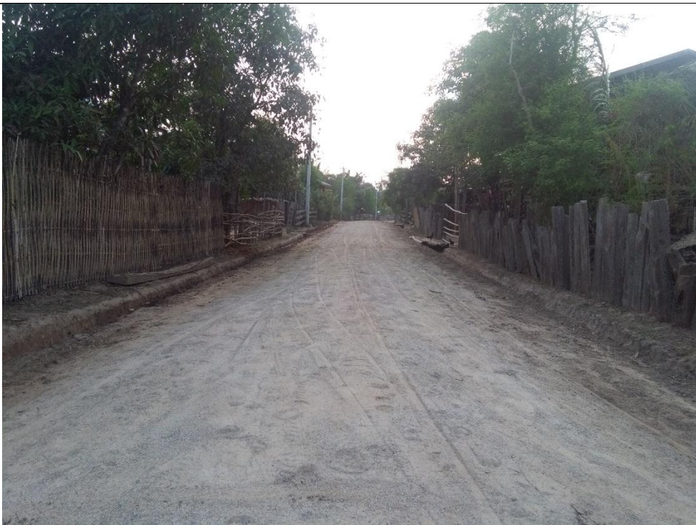
တတိယနှစ်စီမံကိန်းလုပ်ငန်းခွဲဆောင်ရွက်ပြီးစီးမှုမှတ်တမ်းဓာတ်ပုံ