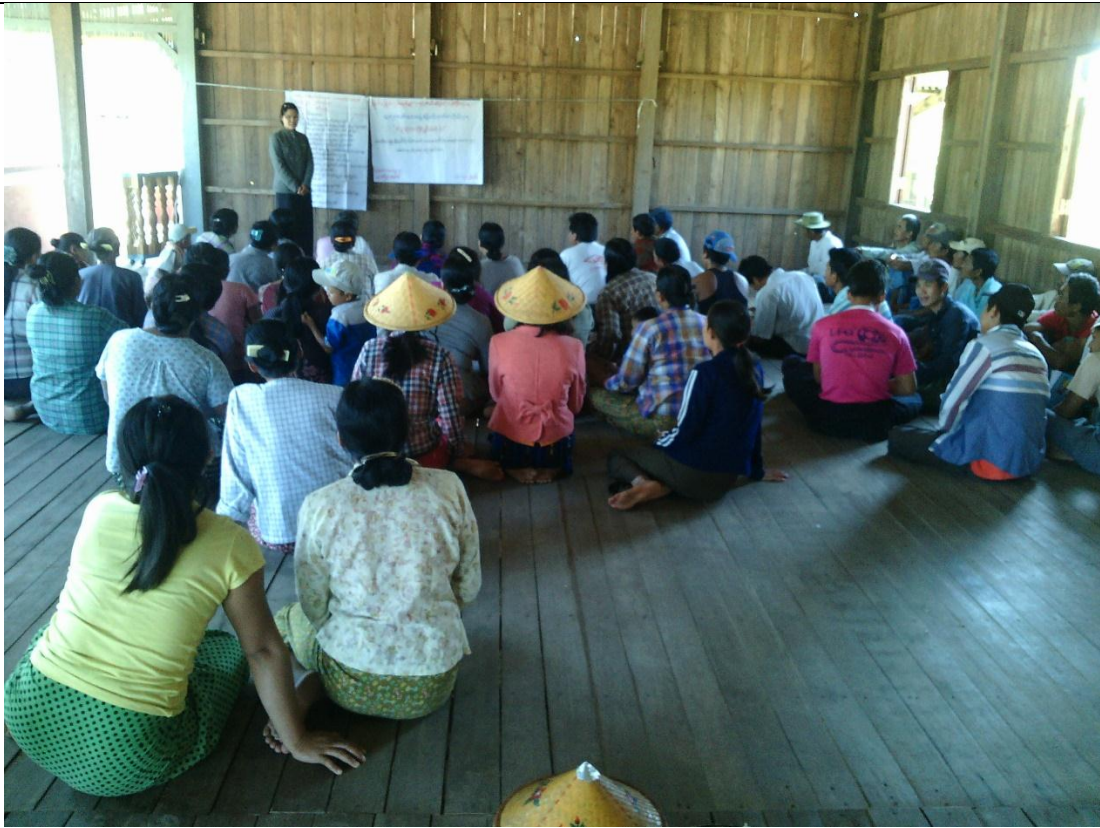
စေတနာ့ဝန်ထမ်းများ ရွေးချယ်ခြင်း မှတ်တမ်းခါတ်ပုံ