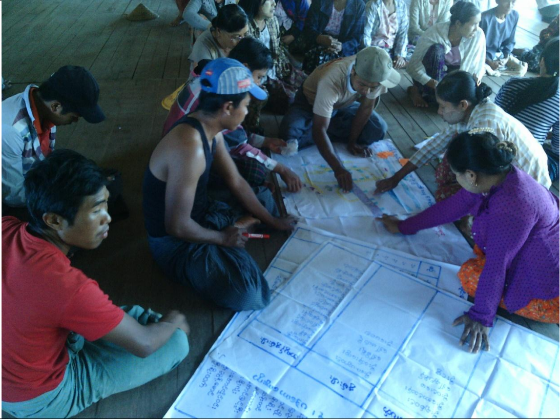
လူငယ်အုပ်စု၏ မှတ်တမ်းခါတ်ပုံ