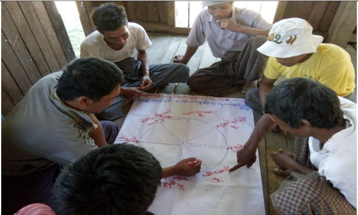
ထိခိုက်လွယ်အုပ်စုများ၏ မှတ်တမ်းဓါတ်ပုံ