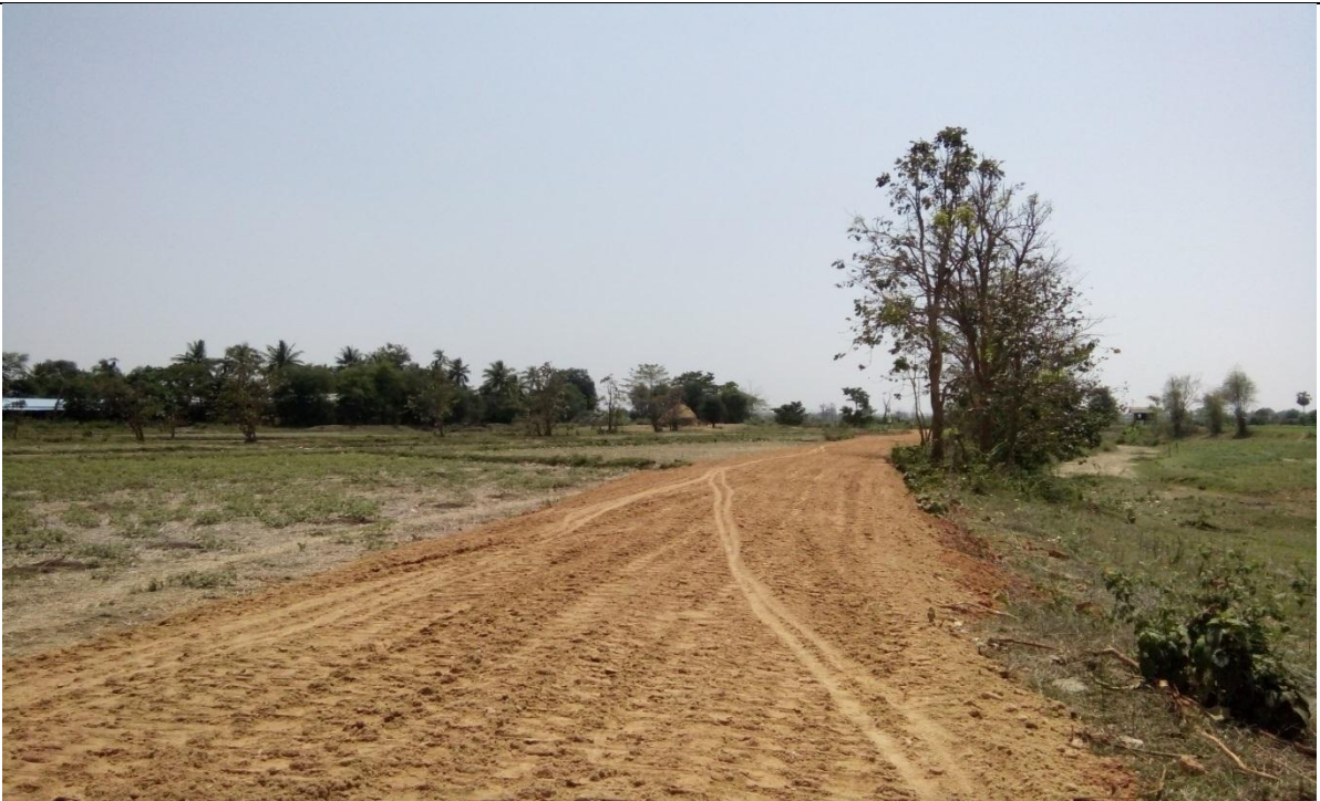
တတိယနှစ်စီမံကိန်းလုပ်ငန်းခွဲဆောင်ရွက်ပြီးစီးမှုမှတ်တမ်းဓာတ်ပုံ