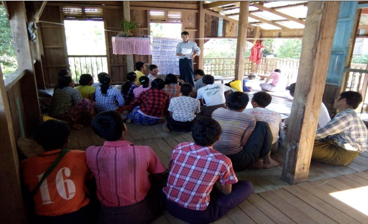
ကော်မတီရွေးချယ်ခြင်း မှတ်တမ်းခါတ်ပုံ