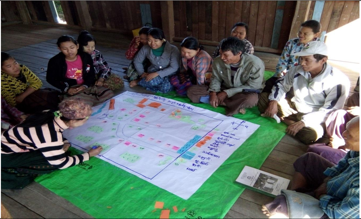
လူငယ်အုပ်စု၏ မှတ်တမ်းဓါတ်ပုံ