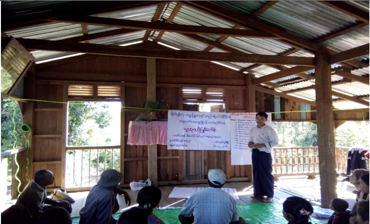
စေတနာ့ဝန်ထမ်းများ ရွေးချယ်ခြင်း မှတ်တမ်းခါတ်ပုံ