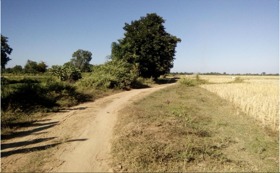
တတိယနှစ်စီမံကိန်းလုပ်ငန်းခွဲဆောင်ရွက်မှီမှတ်တမ်းဓာတ်ပုံ