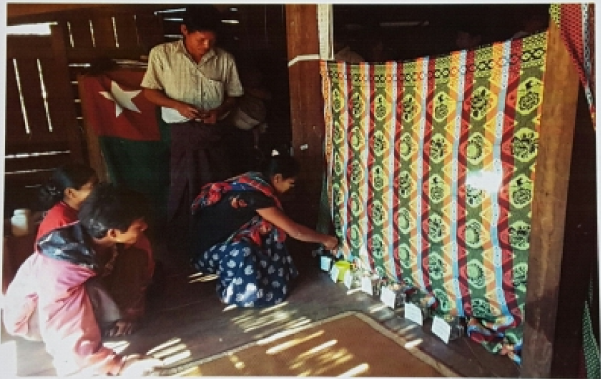
ကနောင်ကျေးရွာ၊ ကံခိုင်ကျေးရွာအုပ်စု လူမှုဆန်းစစ်ခြင်း ကျေးရွာအမျိုးသမီးတစ်ဦး မဲထည့်နေစဉ်