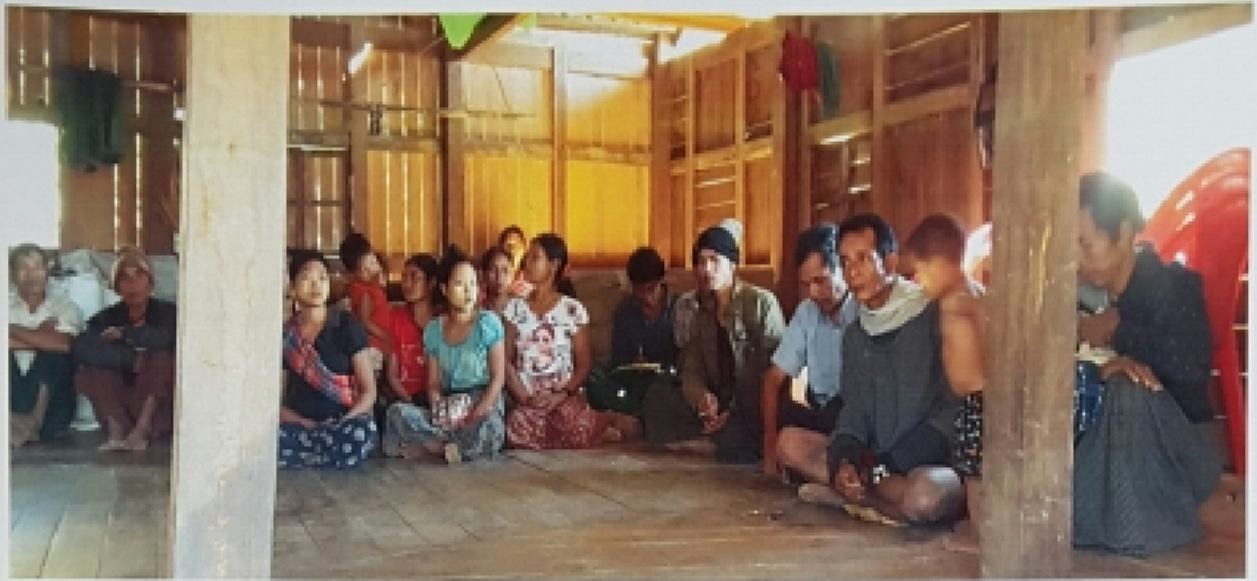
ကနောင်ကျေးရွာ၊ ကံခိုင်ကျေးရွာအုပ်စု ကျေးရွာလူထုအစည်းအဝေး