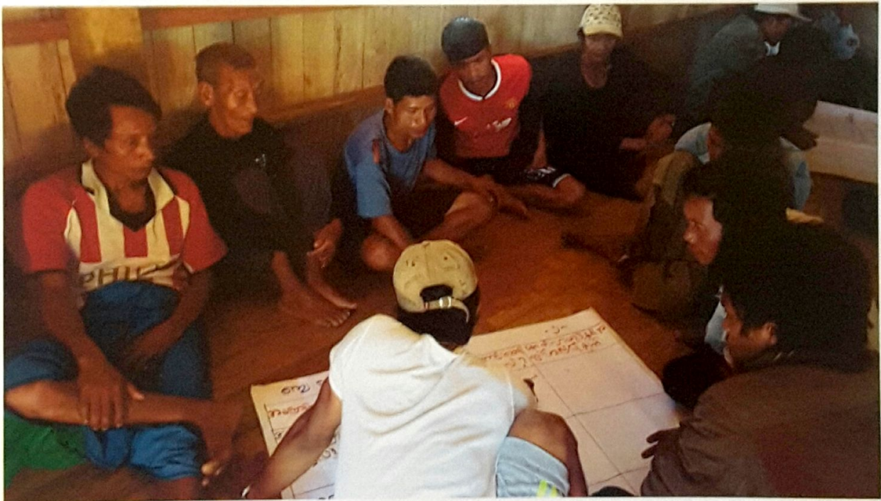
ပေါက်စင်ကျေးရွာ၊ ဒီလောင်ကုန်းကျေးရွာအုပ်စု ကျေးရွာလူထုအစည်းအဝေးမှတ်တမ်းဓာတ်ပုံ