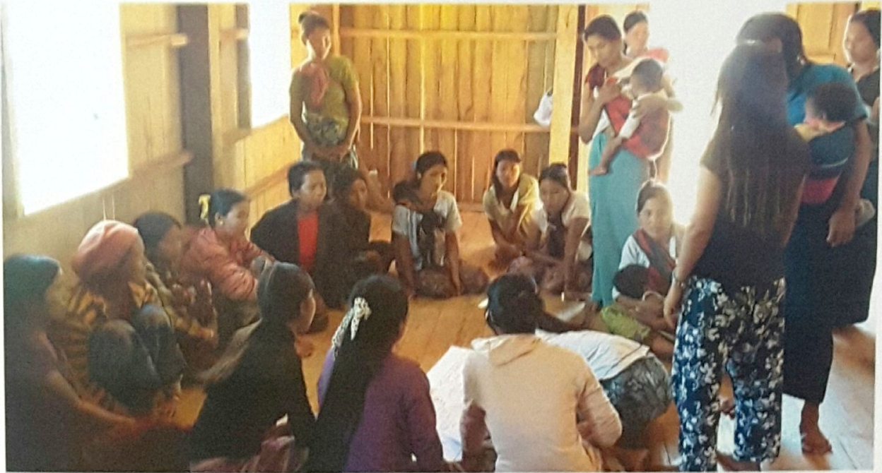
ပေါက်စင်ကျေးရွာ၊ ဒီလောင်ကုန်းကျေးရွာအုပ်စု ကျေးရွာလူထုအစည်းအဝေးမှတ်တမ်းဓာတ်ပုံ