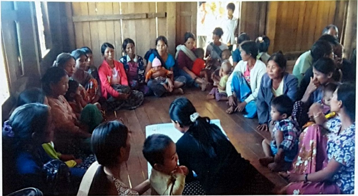
ဒီလောင်ကုန်းကျေးရွာ၊ ဒီလောင်ကုန်းကျေးရွာအုပ်စု ကျေးရွာလူထုအစည်းအဝေးမှတ်တမ်းဓာတ်ပုံ