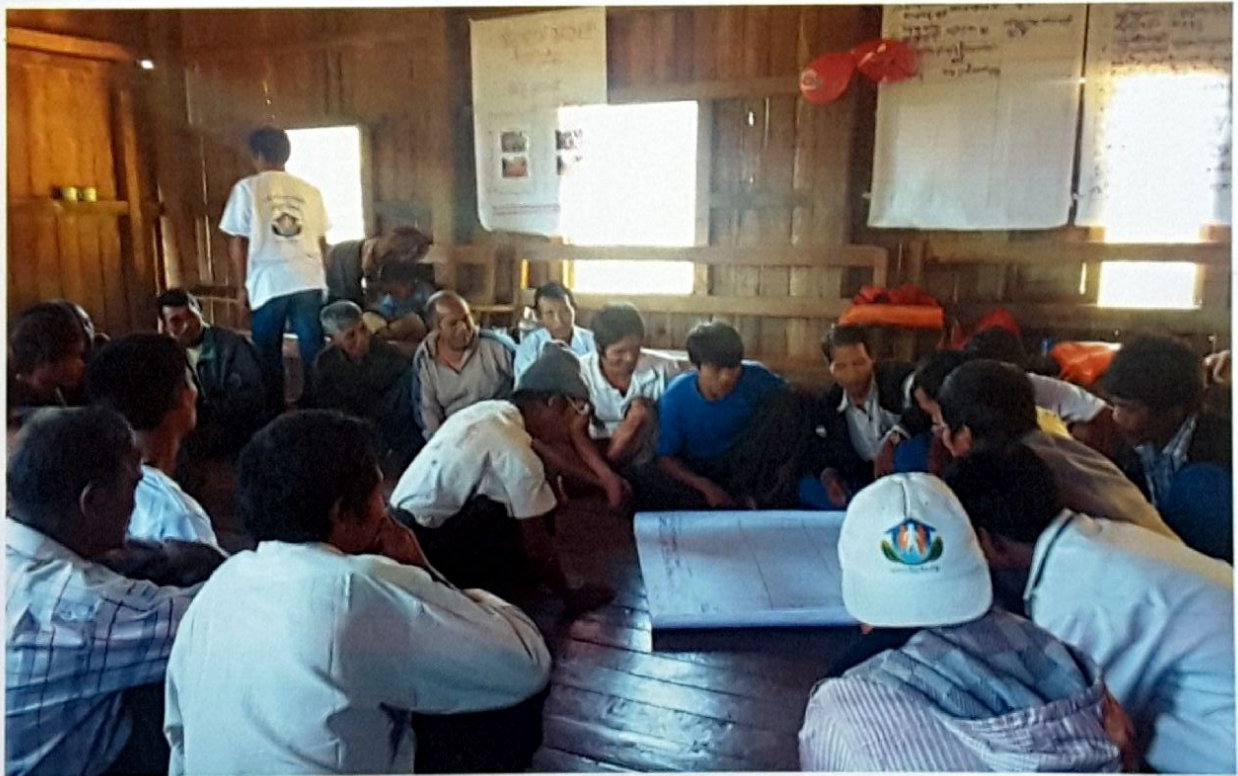
ဒီလောင်ကုန်းကျေးရွာ၊ ဒီလောင်ကုန်းကျေးရွာအုပ်စု ကျေးရွာလူထုအစည်းအဝေးမှတ်တမ်းဓာတ်ပုံ