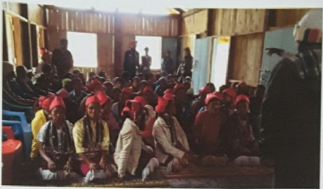
လိပ်ကုန်းကျေးရွာ၊ ရှင်ဝကျေးရွာအုပ်စု လူထုအစည်းအဝေးမှတ်တမ်းတင်ပုံ