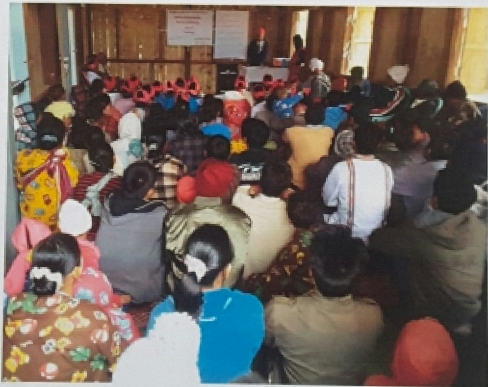
လိပ်ကုန်းကျေးရွာ၊ ရှင်ဝကျေးရွာအုပ်စု လူထုအစည်းအဝေးမှတ်တမ်းတင်ပုံ