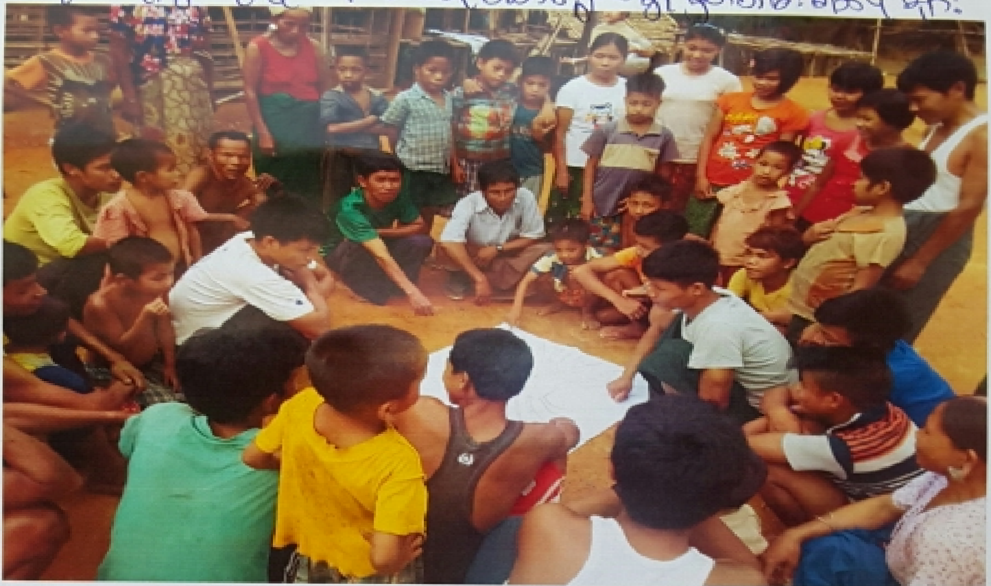
ဖီးတောင်ကျေးရွာ၊ တို့ဆီးပကျေးရွာအုပ်စု ကျေးရွာအစည်းအဝေးမှတ်တမ်းစာတံပုံ

ကျေးရွာ နှင့် နီးစပ်စွာ ဆက်သွယ် ဆောင်ရွက်ရန် မှတ်တမ်းစစ်ပုံများ