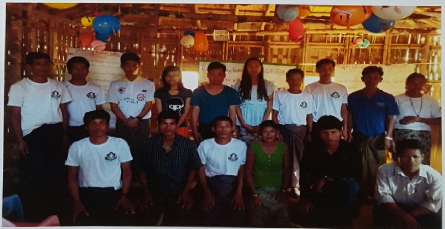
ဖီးတောင်ကျေးရွာ၊ တို့ဆီးပကျေးရွာအုပ်စု ကျေးရွာအစည်းအဝေးမှတ်တမ်းစာတံပုံ