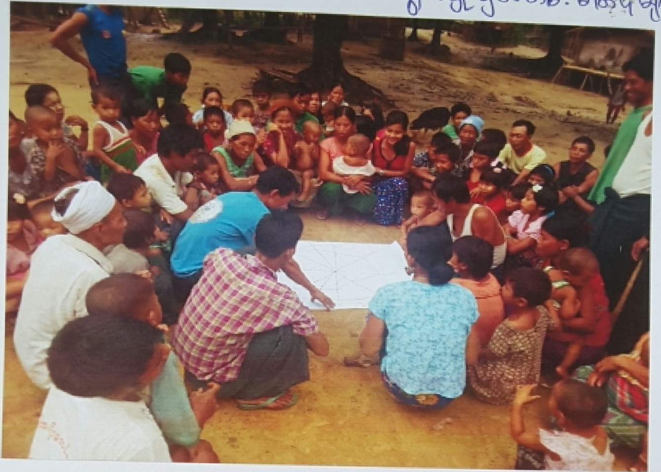
တို့ဆီးပကျေးရွာ၊ တို့ဆီးပကျေးရွာအုပ်စု ကျေးရွာအစည်းအဝေးမှတ်တမ်းဓာတ်ပုံ

၇။ ကျေးရွာ ဖွံ့ဖြိုးရေး အဖွဲ့အစည်း တစ်ခုခု ပြုစုပေးရန် မြန်မာနိုင်ငံတော် အစိုးရက ဆောင်ရွက်ပေးရန် မျှော်လင့်ပါသည်။