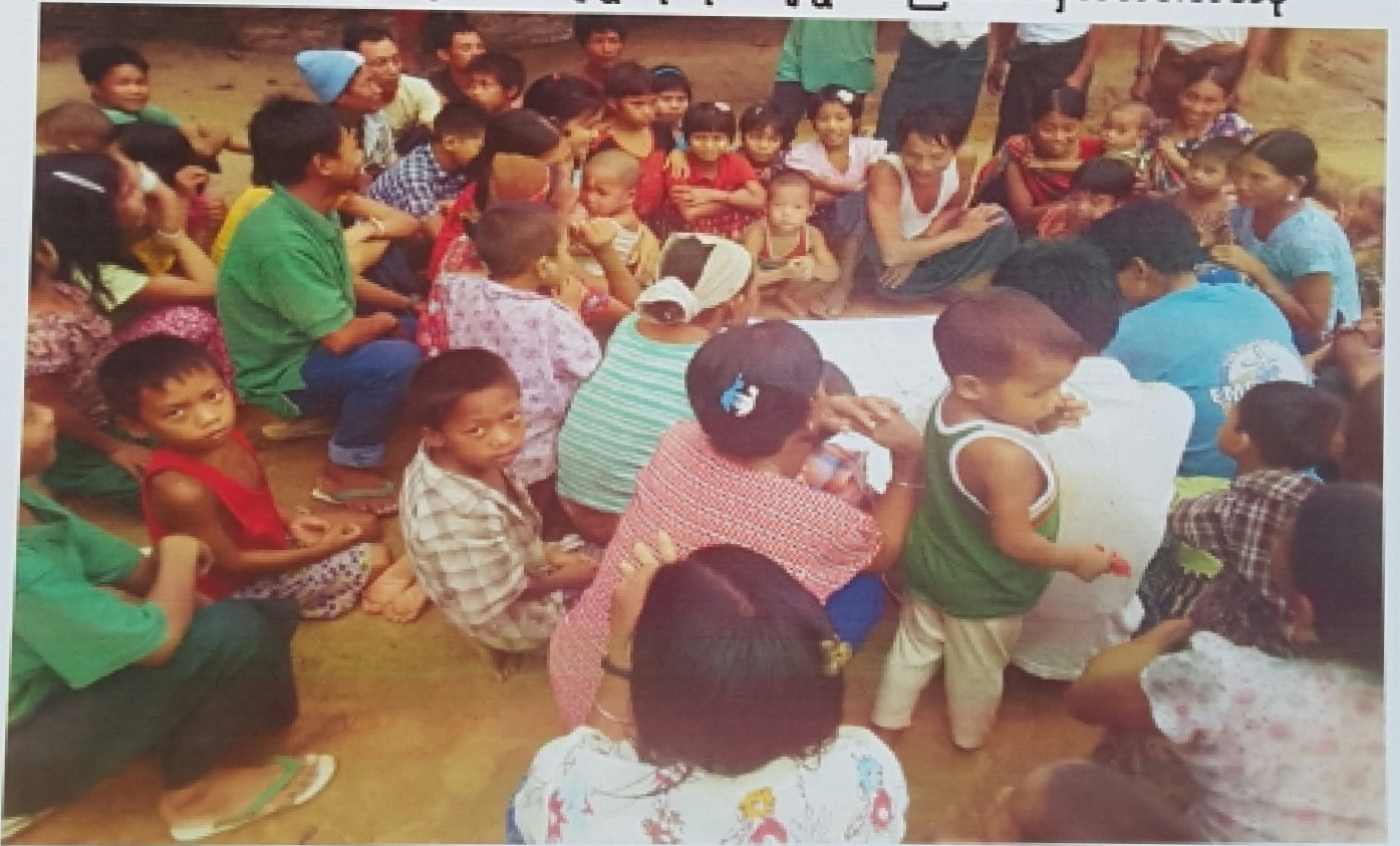
တို့ဆီးပကျေးရွာ၊ တို့ဆီးပကျေးရွာအုပ်စု ကျေးရွာအစည်းအဝေးမှတ်တမ်းဓာတ်ပုံ