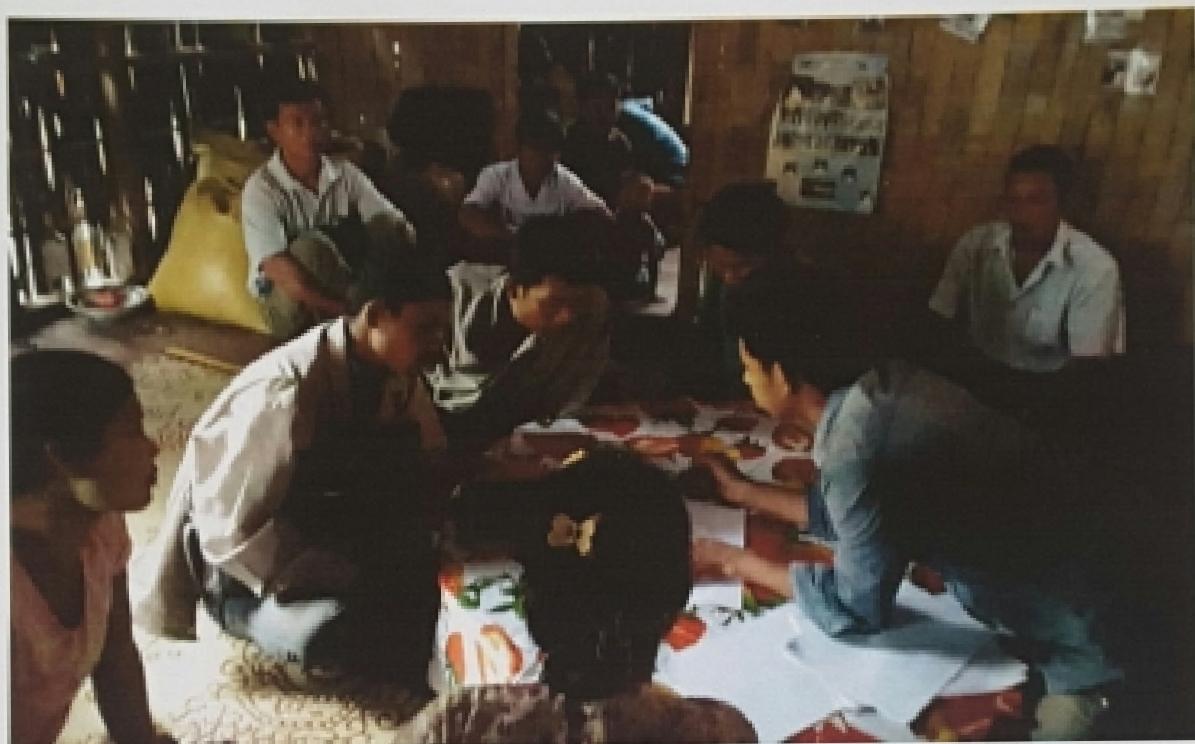
အရှေ့ကွင်းဆိုင်ကော့ရှော့၊ ပိန္နဲတပင်ကော့ရှော့အုပ်စု ကော့ရှော့လူထုအစည်းအဝေးမှတ်တမ်းဖော်စဉ်