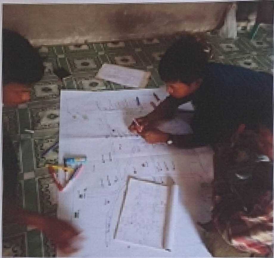
ဆင်းသို့ဝေကုမ္ပဏီ၊ ဝေဘက်ဂ်မီလီယံကုမ္ပဏီများအဖို့ မေကုမ္ပဏီဂုဏ်ထူးဆောင်ဆုပေးပွဲတော်အခမ်းတင်ပို့