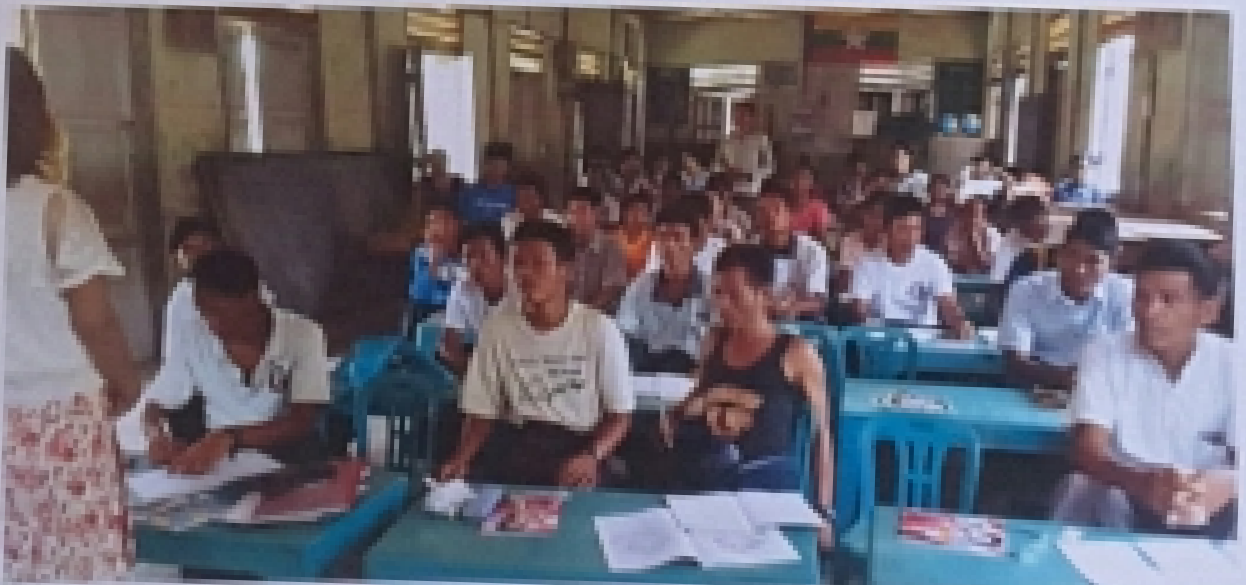
ဆင်းသို့ဝေကုမ္ပဏီ၊ ဝေဘက်ဂ်မီလီယံကုမ္ပဏီများအဖို့ မေကုမ္ပဏီဂုဏ်ထူးဆောင်ဆုပေးပွဲတော်အခမ်းတင်ပို့