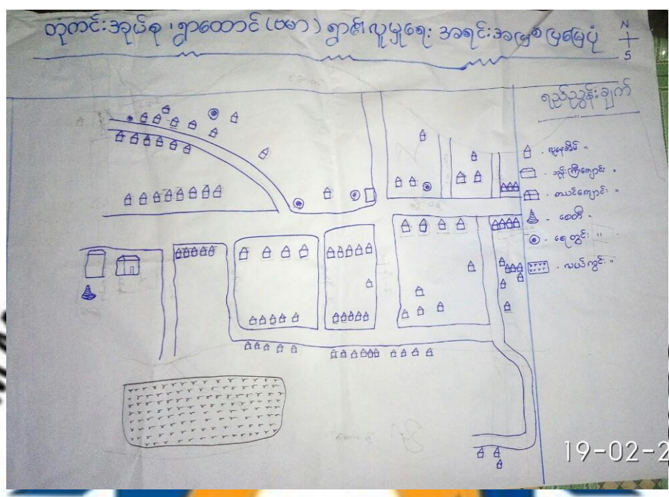
လူမှုရေးနှင့် ကျေးရွာအရင်းအမြစ်ပြုပြင်မှု သုံးသပ်ချက်