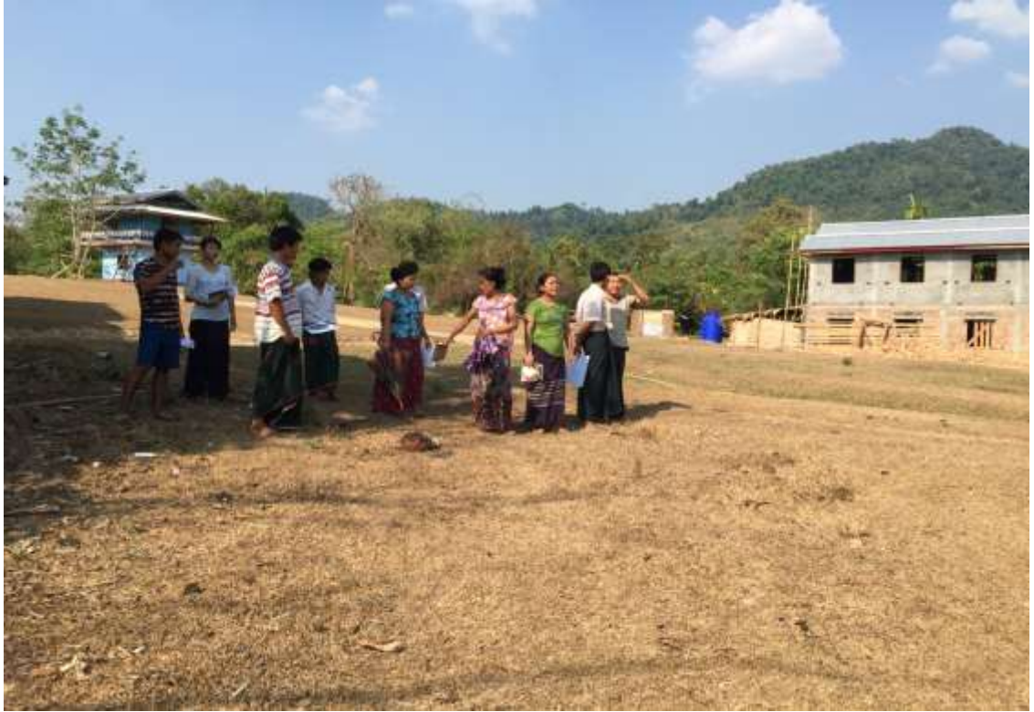
စီမံကိန်းလုပ်ငန်းခွဲပြုလုပ်မည့်နေရာအား တိုင်းတာခြင်း