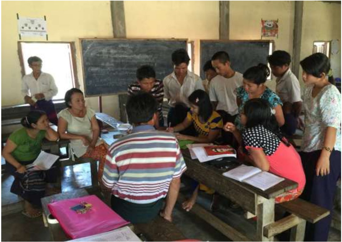
PRA Tools အသုံးပြု၍ ကျေးရွာအခက်အခဲဖော်ထုတ်ခြင်း