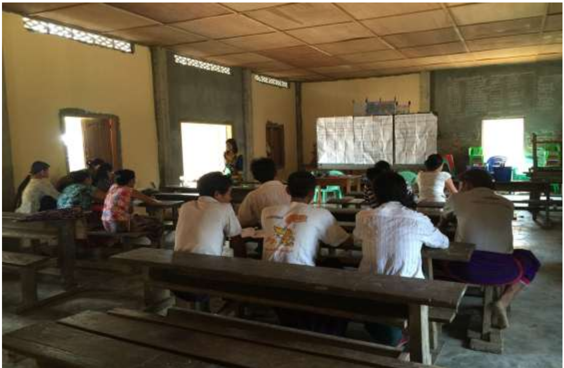
ကော်မတီဝင်များအစည်းအဝေးကျင်းပခြင်း